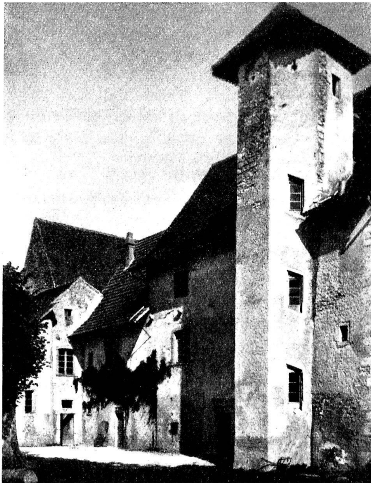
Löwenburg. Hofseite mit Propsteigebäuden.