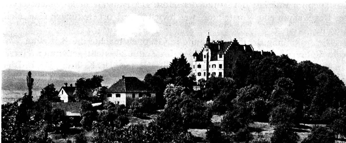
Schloß Sonnenberg von Osten gesehen.