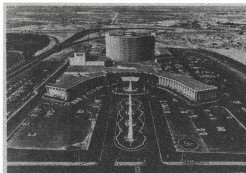
8 «Caesar's Palace» in Las Vegas; aus / d'après «Learning From Las Vegas».

In archithese 16/1975 wird der Bürgenstock mit Las Vegas verglichen.