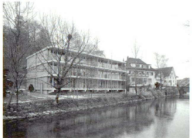
Mehrfamilienhaus Kirchstrasse, Sarnen