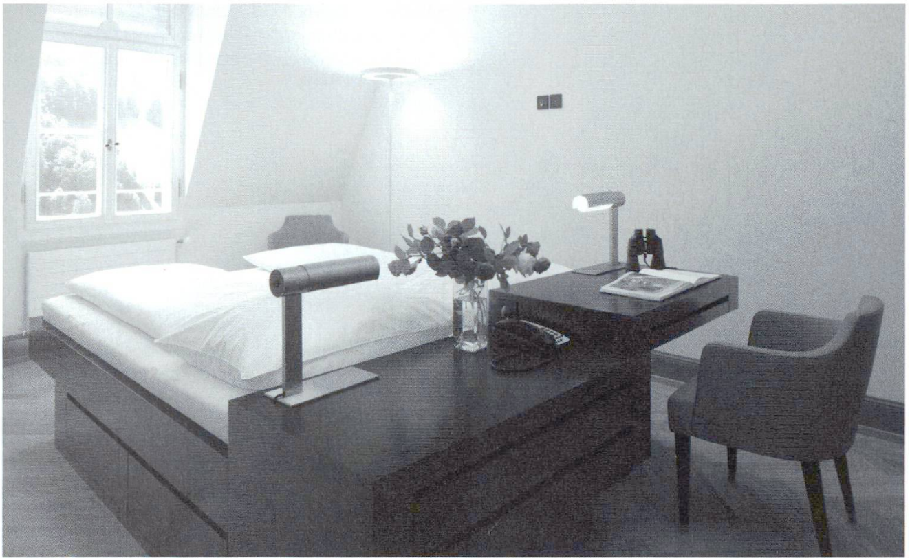
Umbau Hotel Pax Montana, Flüeli-Ranft: Der Ausbau der Dachzimmer erfordert eine eigenwillige Lösung: Das Bett wird als freistehendes Möbel mit Schreibtisch und Sofa kombiniert und macht den Dachraum als Einheit erfahrbar. Architektur: Tropeano Pfister Schiess, Zürich.

Potential, zu weiteren Ausnahmegewilligungen bei der Handhabung der Lex Koller zu führen.