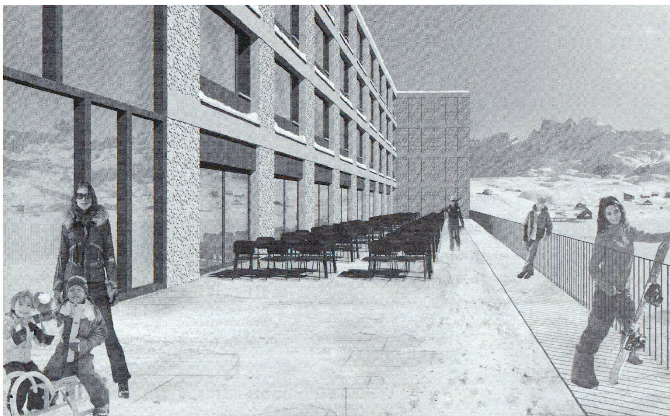
Neubau Hotel Melchsee, Melchsee Frutt: Der Neubau knüpft an die Traditionen der historischen alpinen Hotelbauten an. Grosszügige Hallen, weite Terrassen und eine sorgfältige Materialisierung machen die Architektur und die Natur für die Gäste erfahrbar. Architektur: Lussi + Halter, Luzern.

besonders zum Bewegen und Sein einlädt. Ein restauriertes Hotel Pax Montana hat aus touristischer Sicht eine sehr gute Zukunft, da es die bestehenden Trends in besonderem Masse abdecken kann!