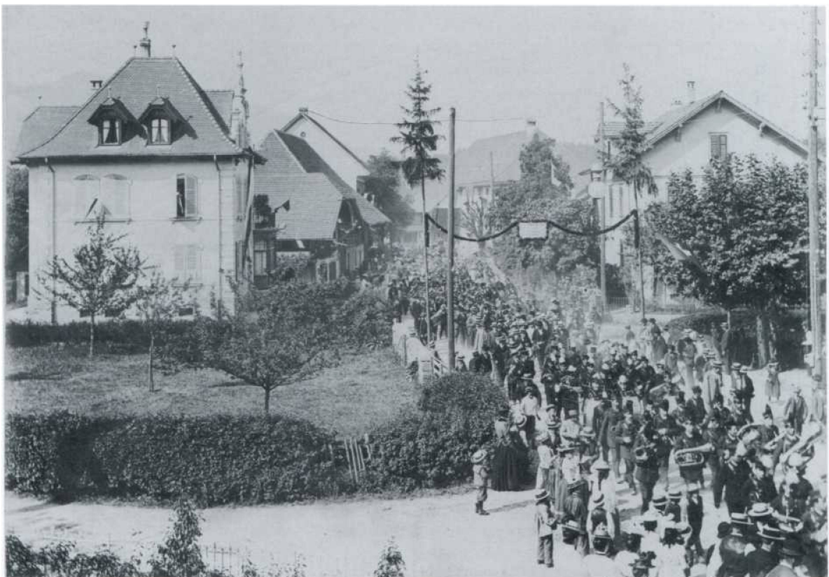
Festumzug zur Einweihung des neuen Schulhauses