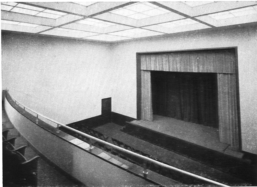
Schulwarte Bern Der Vortragssaal mit Schulbühne von der Empore aus gesehen