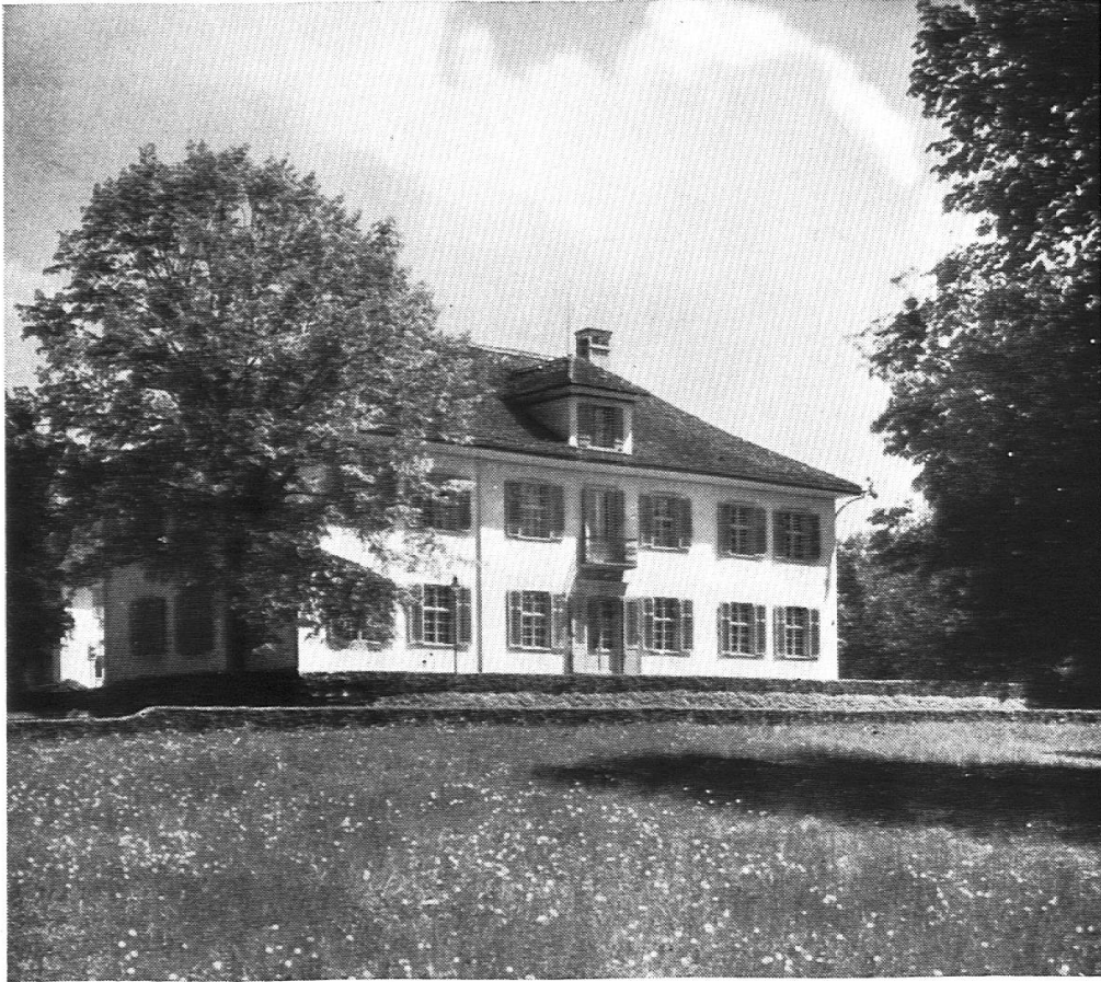
Der Beckenhof in Zürich Sitz des Pestalozzianums seit 1927