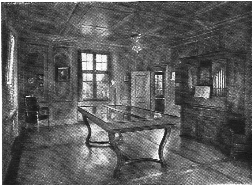
Das Pestalozzizimmer im Beckenhof mit der Orgel aus Pestalozzis Institut in Yverdon