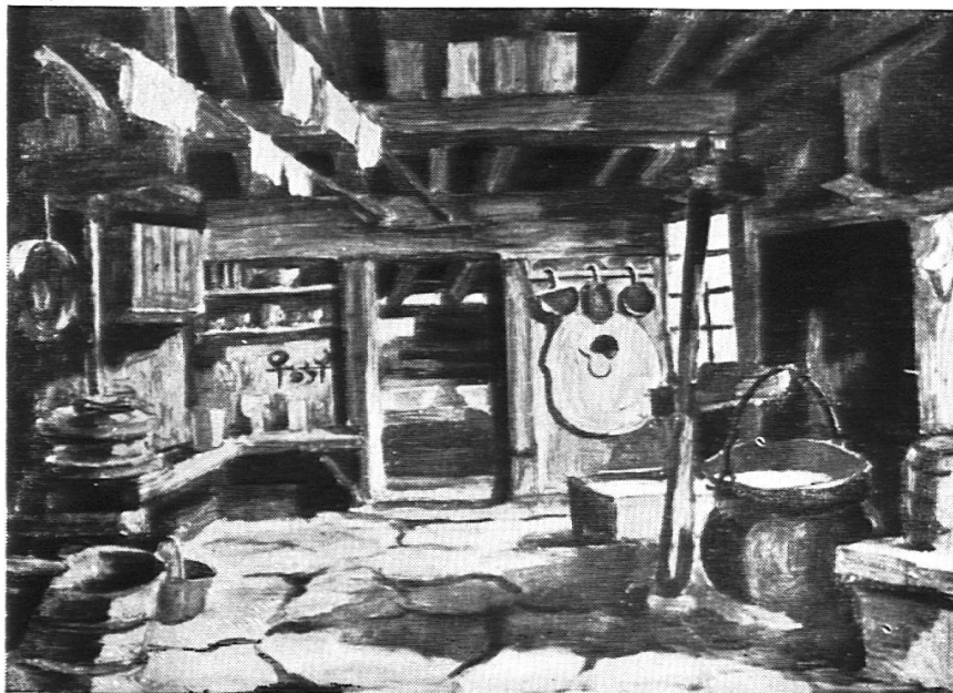
In einer Alphütte (3. Bildfolge)