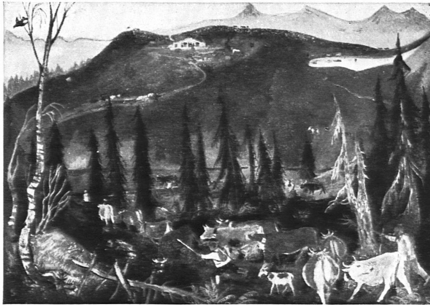
Alpaufzug (2. Bildfolge)