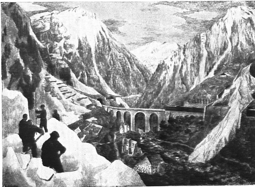
Lawine und Steinschlag (1. Bildfolge)