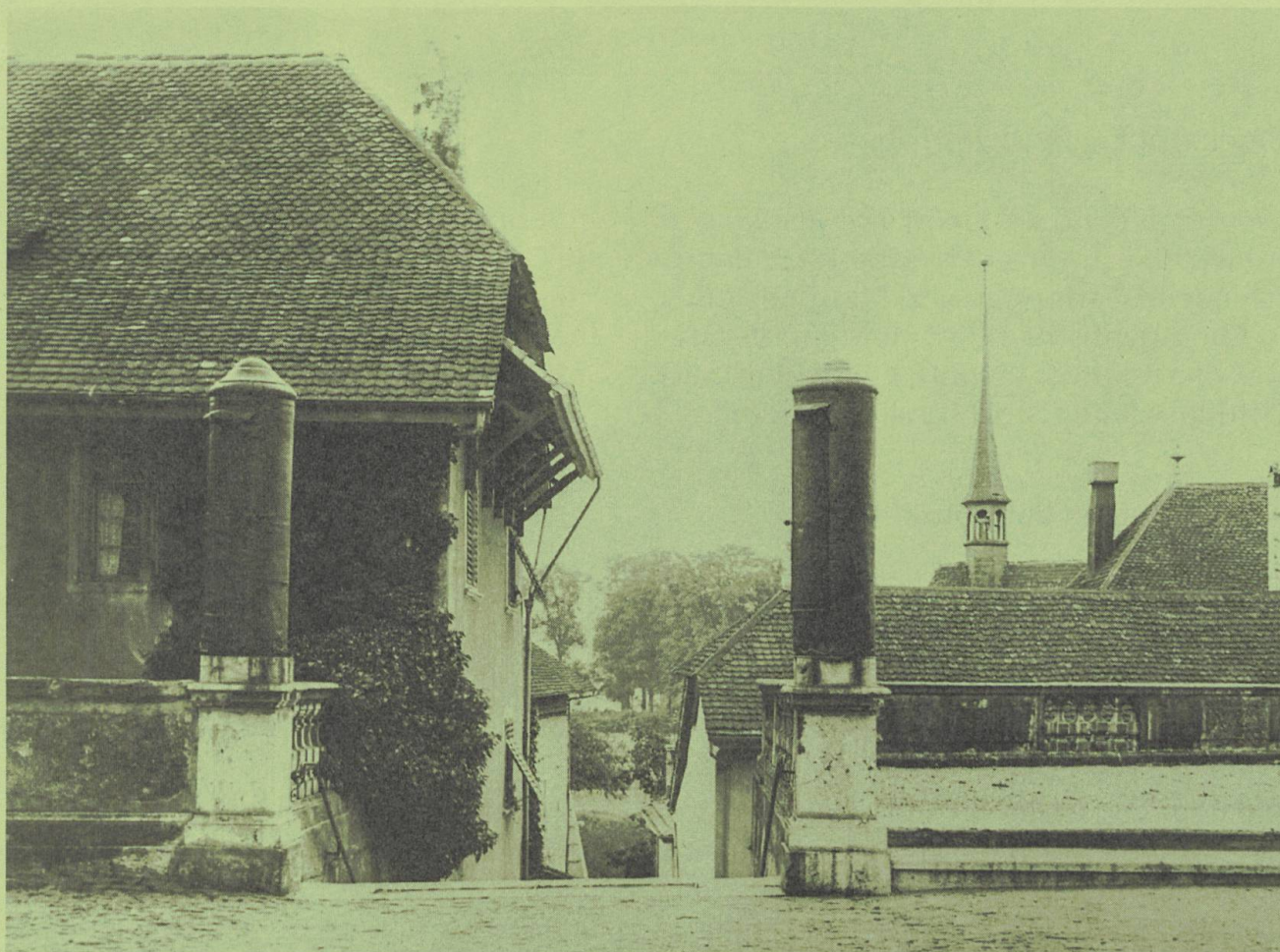
Solothurn Hermessäulen bei der Katzenstiege um 1900.

Im sogenannten Lapidarium I, im Westflügel der Jesuitenkirche, wird gegenwärtig das Solothurner Steinmuseum neu eingerichtet. Da in diesem Zusammenhang etliche dort stehende Steine versetzt und verschoben werden müssen, waren auch Kantonsarchäologie und Denkmalpflege involviert. Die beiden «Hermessäulen», die 1608