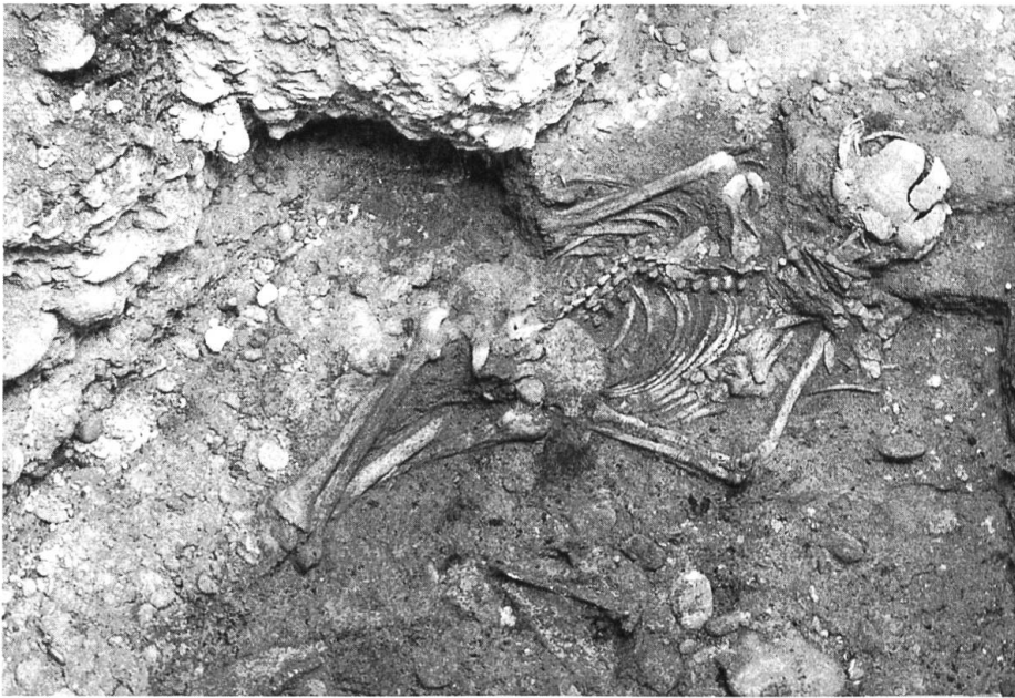
Das freigelegte Skelett 1. Die Unterschenkelknochen sind über dem Knöchel durchtrennt, die Füße liegen beim Oberkörper.

Amputation aus medizinischen Gründen müssten Sägespuren sichtbar sein. Am ganzen restlichen Skelett sind keinerlei Verletzungen oder Spuren von Gewalteinwirkung zu erkennen. So kommt als Todesursache am ehesten ein natürlicher Tod infolge von Krankheit, Infektion o. ä. in Frage.