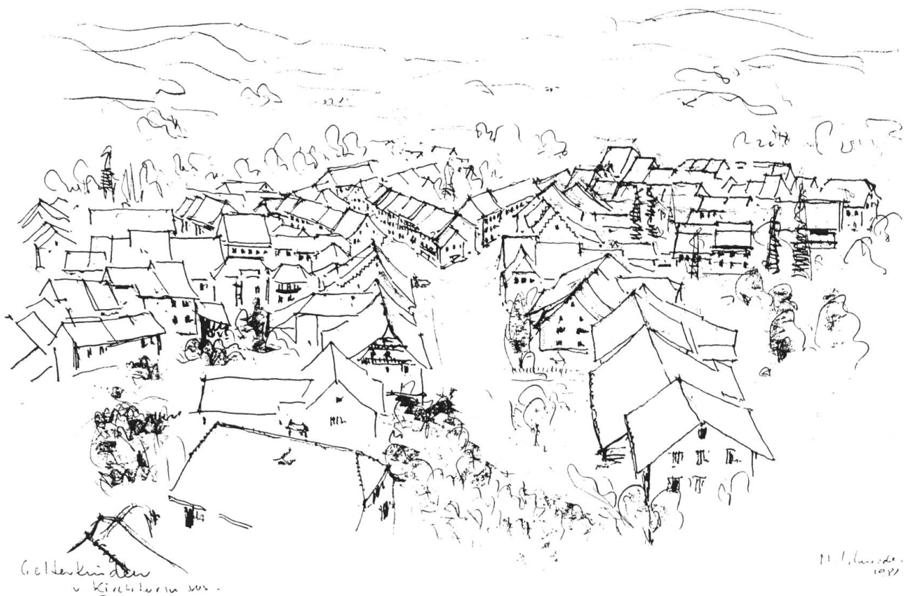
«Dachlandschaft», vom Turm der (reformierten) Kirche aus. Tuschzeichnung von Max Schneider, 1981.