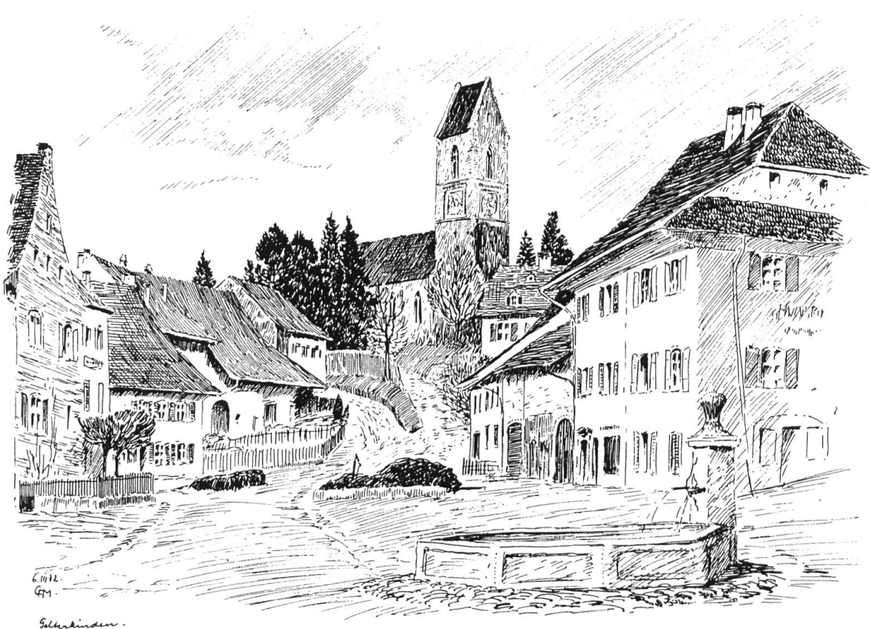
«Gelterkinden, Dorfplatz». Tuschzeichnung von Christian Adolf Müller, 1932.

fünftes bis erstes Jahrhundert vor Christus) gefunden worden. Nicht allzuviel ist zwar über diese unsere «Vorfahren» bekannt. Etwas mehr weiss man dann schon über die nächste Siedlergeneration, die Römer und die Gallorömer, die Romanen. Auf dem Gebiet der heutigen Gemeinde sind zwei römische Gutshöfe errichtet worden und es darf angenommen werden, dass bereits zu dieser Zeit die heutige Dorfbrunnenquelle gefasst war und eine «Strasse» vom Aaretal ins Rheintal hier vorbei führte. Auf dem Gelterkinder Berg soll sich eine gallorömische Viereckschanze, also ein keltisch-römischer Kultbau befunden haben.