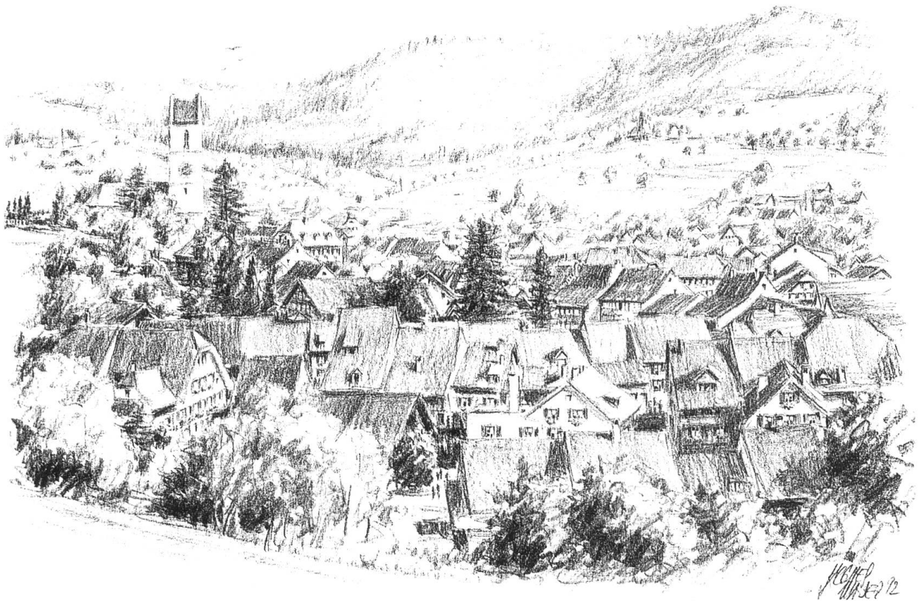
«Panorama», Sicht von Norden nach Süden. Bleistiftzeichnung von Jacques Mader, 1992.