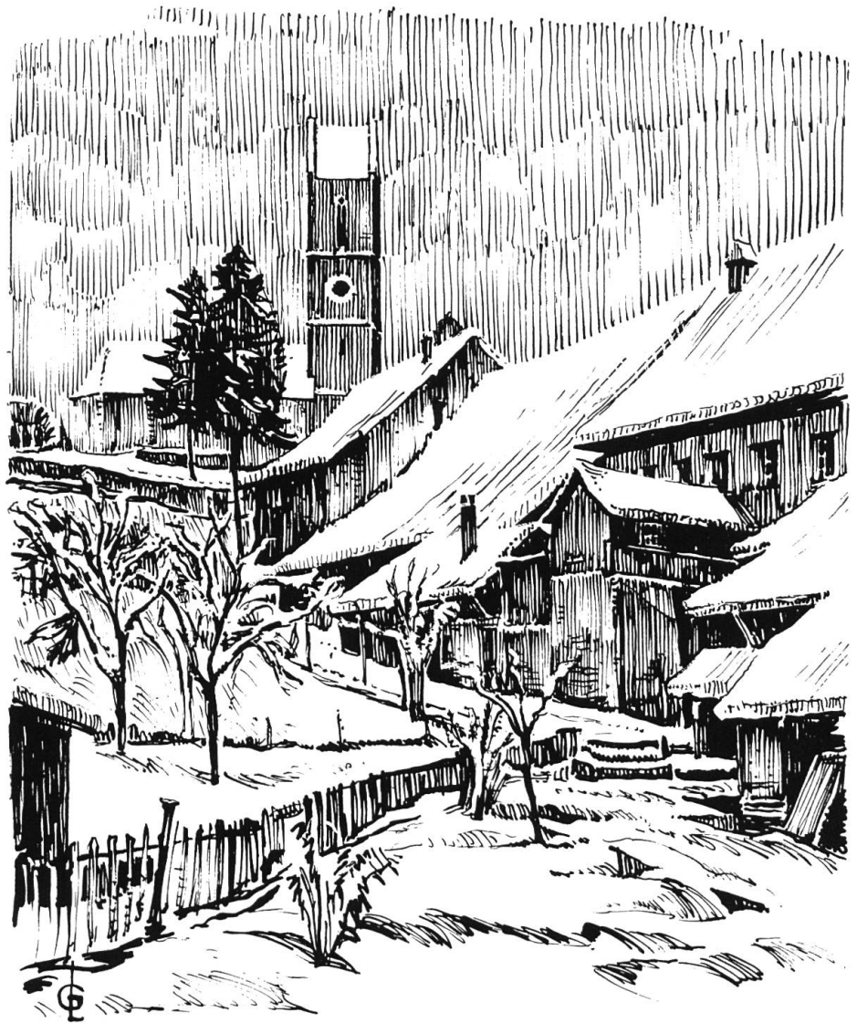
«Dorfpartie mit (reformierter) Kirche». Federzeichnung von Gottlieb Lörtscher, 1966.