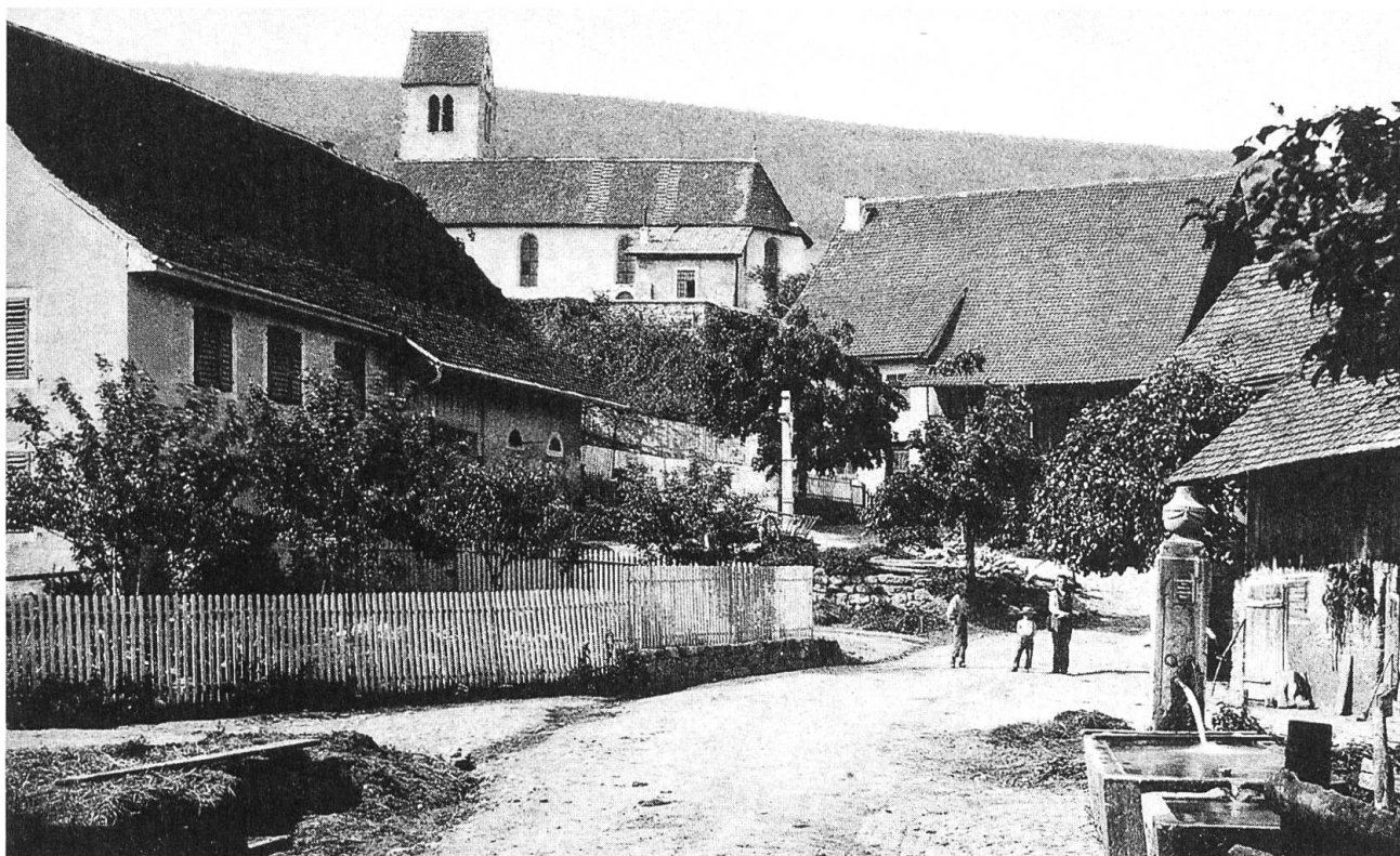
Blauen. Ansichtskarte von 1911.