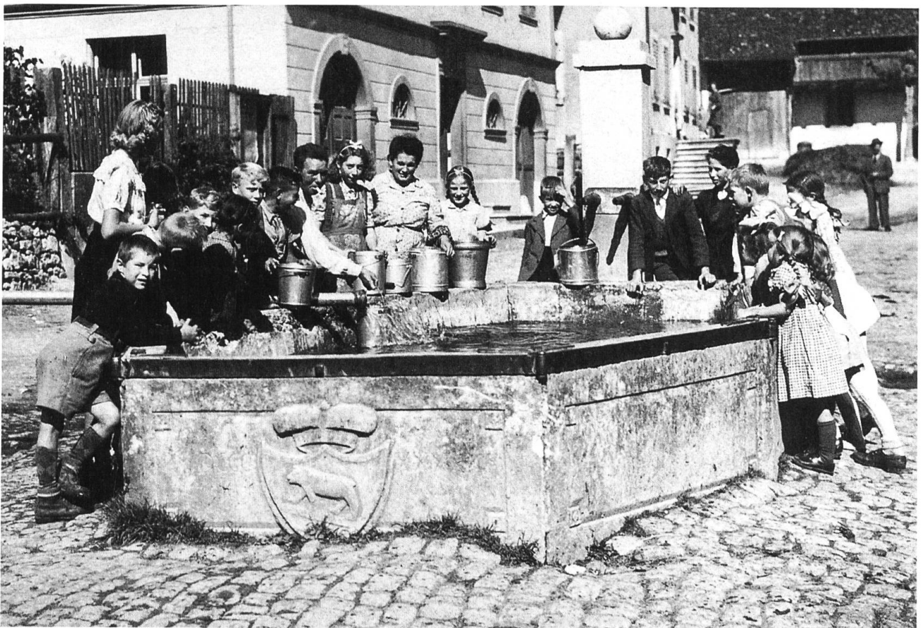
Blauen vor 50 Jahren. Wassernot: das Wasser wird im «Guete Brunnen» geholt.

Dieser Beitrag erschien bereits im «Laufentaler Jahrbuch» 1997.