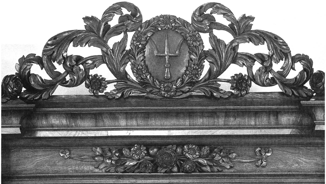
⑤ Detail vom Buffet der Gartnernzunft mit dem geschnitzten Zunftwappen.

lich herausgefunden, dass im Jahre 1840 (also nur wenige Jahre nach der Versteigerung des Basler Münsterschatzes), das Buffet der Safranzunft in den Basler Kunsthandel verkauft wurde und darauf in Berliner Museumsbesitz gelangte. 3