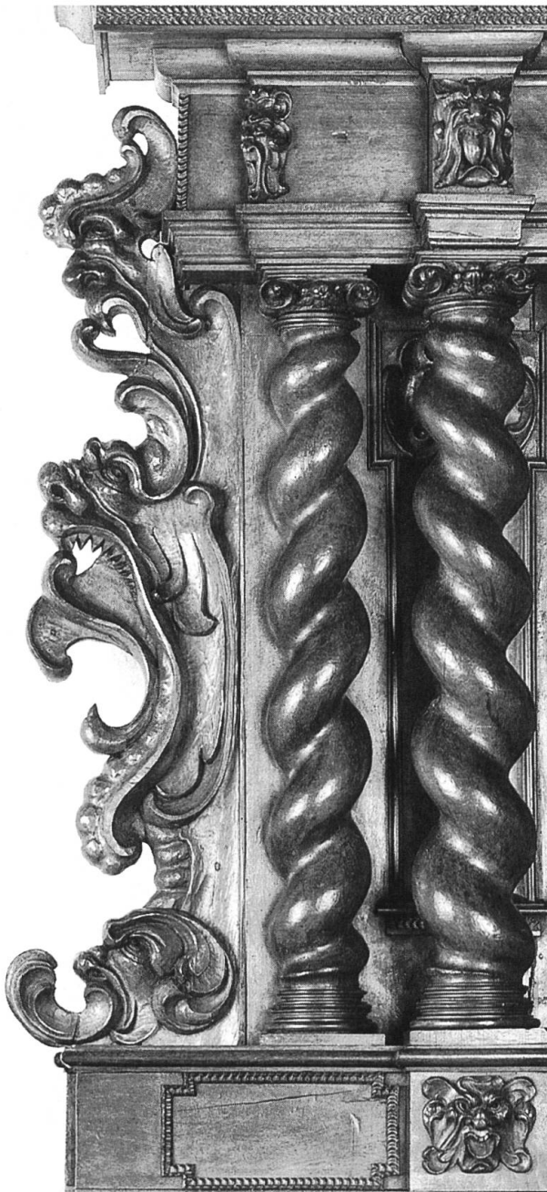
② Detail vom Buffet der Safranzunft mit drei geschnitzten Fratzen im Knorpelwerkstil.