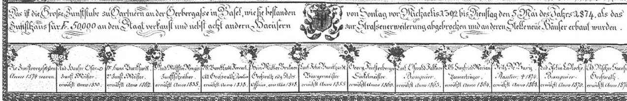
© Innenansicht um 1874 der Grossen Zunftstube der Gärtnernzunft vor dem Abbruch des Zunfthauses im Jahre 1874. Aquarell mit Collage von Johann Rudolf Wölfflin-Mengis. (Historisches Museum Basel, Inv. Nr. 1927.346.)

zeigt den ursprünglichen Standort des Buffets in der grossen Zunftstube (Abb. 6).