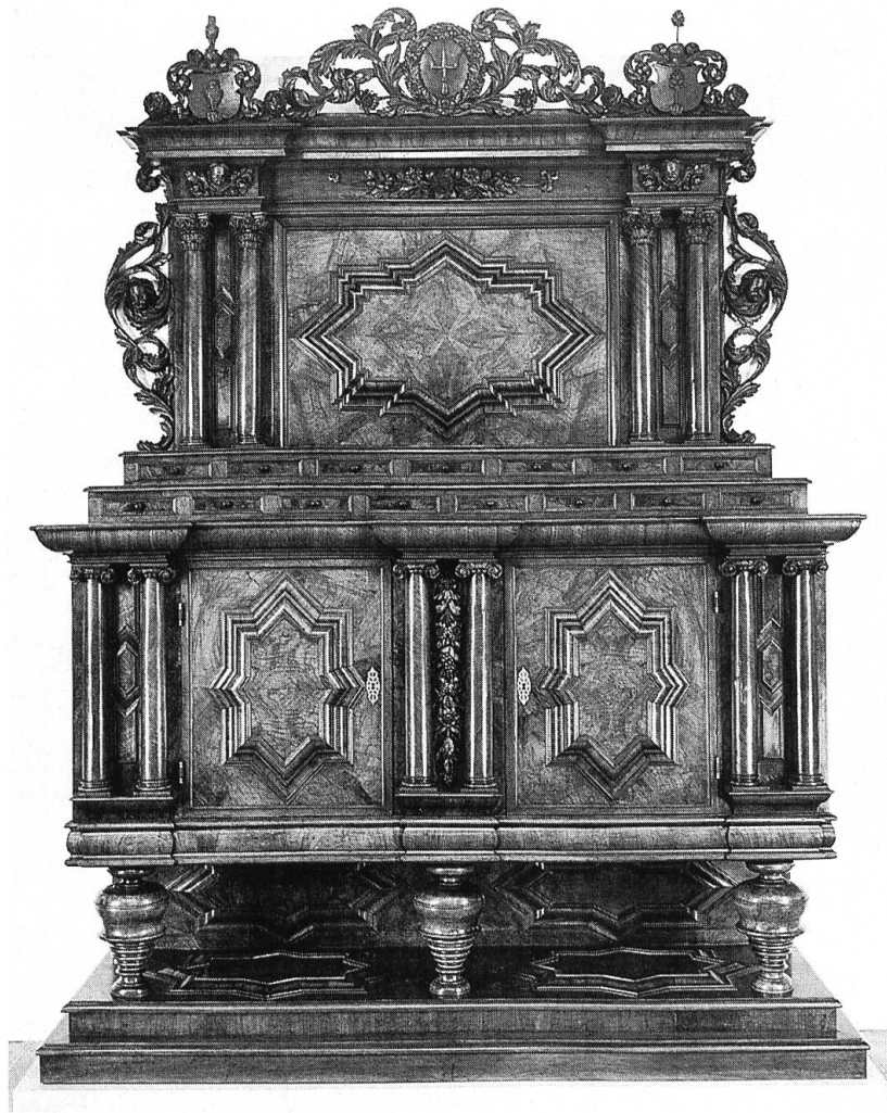
④ Buffet der Gärtnernzunft, von Matthias Müller. 1710. Nussbaumholz. (Historisches Museum Basel, Inv. Nr. 1901.54. Depositum E. E. Zunft zu Gärtnern).

Bis ins frühe 18. Jahrhundert, als das Basler Buffet allmählich aus der Mode kam, blieb sein Grundaufbau gleich. Doch der Barockstil ermöglichte zahlreiche Spielarten von unverwechselbaren, charaktervollen Möbeln.