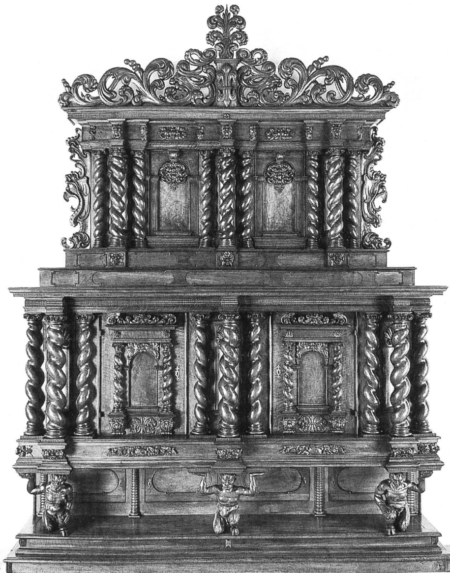
① Buffet der Safranzunft, von Johann Heinrich Keller. 1964. Nussbaumholz. (Befristete Leihgabe der Staatlichen Museen zu Bern, Kunstgewerbemuseum).

Zwei herausragende Barockmöbel, die grössten und prächtigsten Basler Zunftbuffets, sind in der Barfüsserkirche auf befristete Zeit zusammen ausgestellt: das Gartnern-Zunftbuffet nach Abschluss seiner 1996 erfolgten Restaurierung und das Safran-Zunftbuffet als Leihgabe des Kunstgewer-