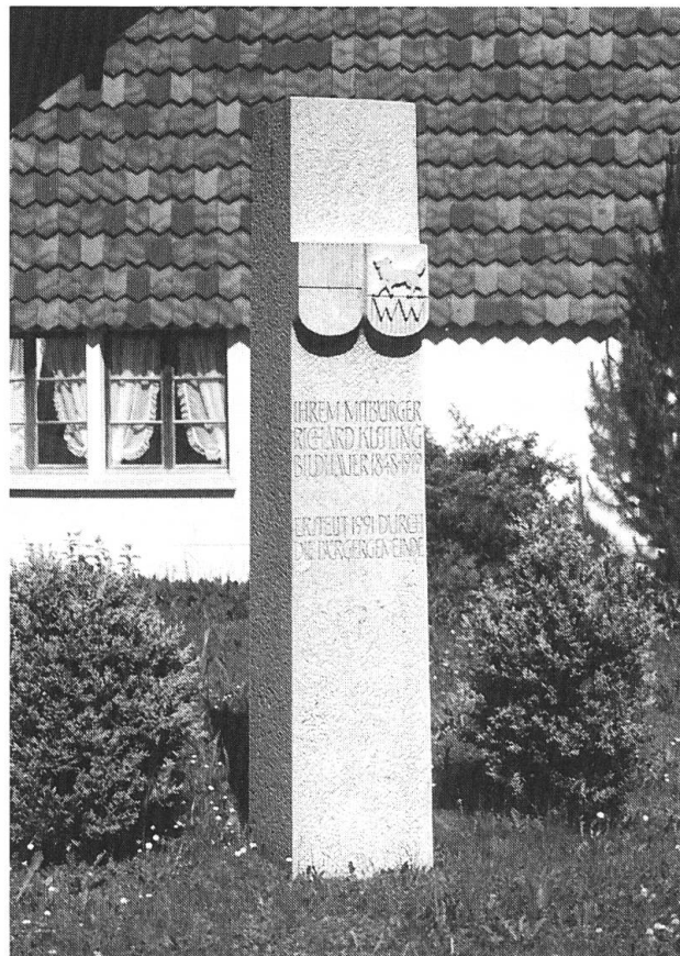
Gedenkstein, errichtet 1991, geschaffen von Fridolin Huber, damals in Wolfwil.

Die Solothurner Kissling haben das «Wappen der Bauern» mit der Pflugschar, dem Zeichen für Ackerbau. Aus Kappel ist ein solches Wappen schon von 1693 nachgewiesen. 2