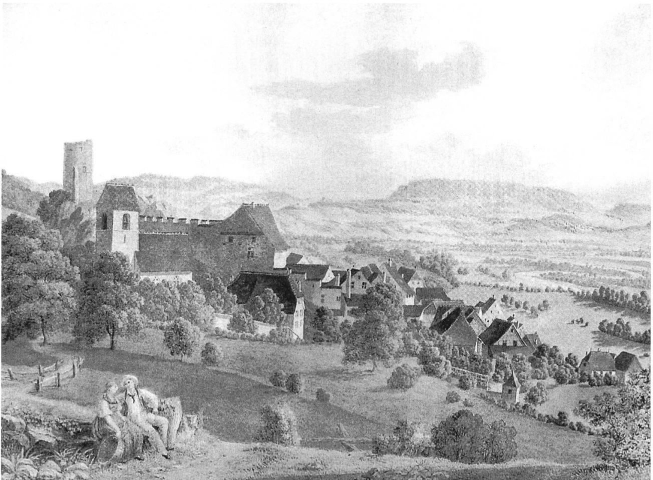
Münchenstein. Aquarell von L. Luttinghausen (1783–1857).