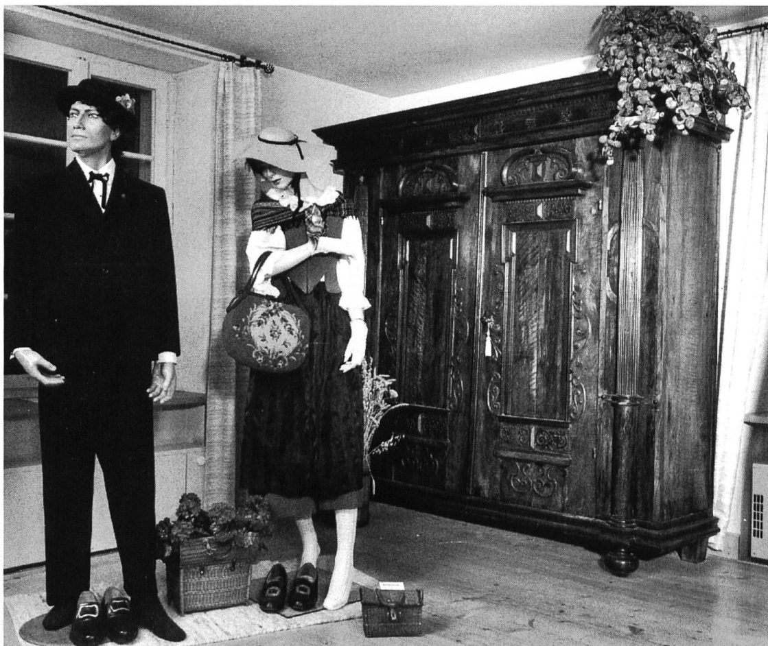
Die Ausstellung «Documenta 700» soll auch das Leben in Laufen in all seinen Dimensionen sichtbar machen. Tracht der Laufner Stadtbürger.

und so wird mit einfachen Mitteln die Sonderausstellung integriert in die Dauerausstellung. Das Museum lässt sich dann betrachten wie ein Bilderbuch: die Dokumente entsprächen dem geschriebenen Text und Kostüme, Werkzeuge und Mobiliar wären die passende Illustration dazu. Dadurch gewinnen beide Bereiche an Anschaulichkeit und Reiz, und die Besucher und Besucherinnen erhalten einen ungleich reichhaltigeren Eindruck von den angeschnittenen Themen.