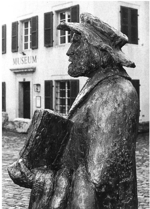
Anlässlich des 700-Jahr-Jubiläums zeigt das Laufentaler Museum Dokumente aus der Geschichte der Stadt Laufen. Dazu zählt auch das Werk des Buchdruckers und Humanisten Helias Helye.

Dementsprechend ist die Ausstellung gegliedert in verschiedene Themenbereiche. Am Anfang steht natürlich der Original-Stadtbrief vom 26.12.1295 (nach alter Zeit-