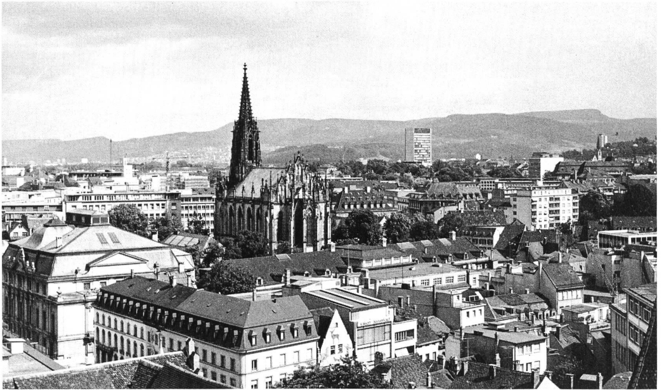
Elisabethenkirche 1965, aufgenommen vom Westgiebel der Leonhardskirche.