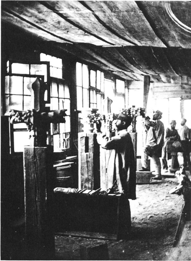
Arbeitshütte der Steinhauer bei der Elisabethenkirche, um 1862.

darin eingespannten gusseisernen Kandelabern und das mit Krabbengiebeln und Fialtürmchen verzierte Chorgestühl setzen, wie die reich geschnitzte Kanzel, unerlässliche Akzente für die Gesamtwirkung. Wie sehr Bauherr und Architekt um eine einheitliche Konzeption des Baus und seiner Ausstattung bemüht waren, veranschaulichen die zahlreichen Studien und Entwürfe zur Kirchengestaltung. Tatsächlich ist es ihnen gelungen, eine im schweizerischen Denkmälerbestand einzigartige künstlerische und architektonische Einheit zu schaffen, die für die Kunstauffassung des 19. Jahrhunderts exemplarisch steht.