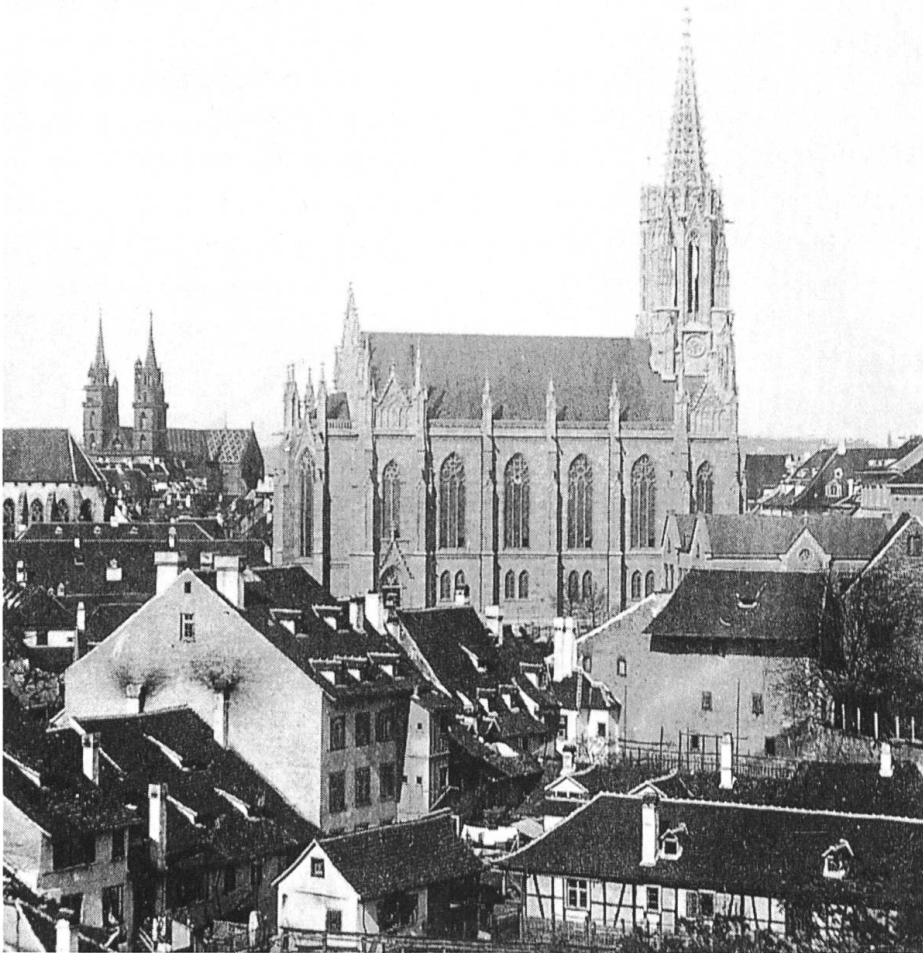
Die Elisabethenkirche – auch städtebaulich ein Gegenüber für das Münster.

mit dem Bau des Casinos den ersten kulturell-gesellschaftlichen Bau gesetzt, 1829–1831 folgte der Bau des Stadttheaters und ab 1870 entstanden weitere repräsentative Grossbauten, 1872 die Kunsthalle, 1875 das neue Stadttheater, 1876 der Musiksaal, 1877 das Steinenschulhaus und 1887 der Südtrakt der Kunsthalle. In diesem neuen für die Kultur bestimmten Stadtquartier setzte Merian mit der Elisabethenkirche, dem Pfarrhaus und dem Schulhaus einen weiteren städtebaulichen und kulturellen Akzent.