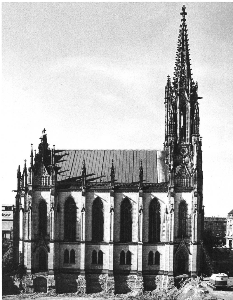
Elisabethenkirche Südseite, nach Abbruch der Christoph Merianschen Kleinkinderschule 1969.

Die Grösse und Aufwendigkeit der baulichen und restauratorischen Massnahmen führten zu einer auch finanziell aufwendigen Restaurierung. Die Kosten waren 1989 auf über 9 Mio. Franken veranschlagt. Dieser Betrag konnte von der evangelisch-reformierten Kirchgemeinde, welche das Gotteshaus nicht mehr nutzte, nicht voll getragen werden. Dem geistigen und kulturellen Erbe des Erbauers verpflichtet, übernahm in dieser Situation die Christoph Merian Stiftung die Verantwortung und übernahm, wie auch der Kanton, ungefähr einen Drittel der gesamten Kosten. Auch der Bund, vertreten durch die Eidgenössische Kommission für die Denkmalpflege, übernahm seine Verpflichtung gegenüber dem national bedeutenden Bauwerk und beteiligte sich an den Kosten mit rund einem Sechstel.