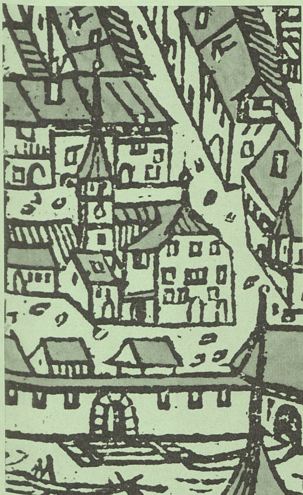
Abb. 1 Ausschnitt aus dem Stadtprospekt nach Vorlage Hans Aspers, 1546. Das Sesshaus der Familie Byss an der «Ryffe».

Einmal mehr zeigen die Resultate die Wichtigkeit solcher stadtgeschichtlicher Forschungen auf. Ähnlich wie im Fall der "Vigierhäuser" vor zehn Jahren, sind im Bereich des Schulhauses am Land mittelalterliche Gebäudereste und Hausparzellierungen gefasst worden. Die westliche Häuserzeile der Schaalgasse scheint schon früh die Flucht des heutigen Landhausquais erreicht zu haben, doch wird eine genauere Datierung erst nach der Ausarbeitung der Befunde möglich sein. Sicher ist, dass der grosse Gebäudekomplex des 1870 neu errichteten Schulhauses auf dem Areal von ursprünglich zwei oder drei selbständigen Häusern steht. Diese Häuser sind wahrscheinlich schon im 15. oder 16. Jh. zu einem stattlichen Sesshaus der Familie Byss zusammengefasst und umgebaut worden. Die ältesten Stadtprospekte zeigen dieses Sesshaus als grossen dreigeschossigen Bau unter einem mächtigen Krüppelwalmdach und mit seitlich angefügtem Treppenturm (Abb.1). Westwärts folgte ein kleiner, von einer Mauer gegen Süden geschlossener Innenhof und ein zweigeschossiges (Neben-?) Gebäude. Es ist denkbar, dass einzelne Fundamente, die bei den Ausgrabungen gefunden wurden, Unterbauten von Trotteneinrich-