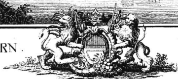
VUE DE LA VILLE DE SOLEURE du Côté du Levant.