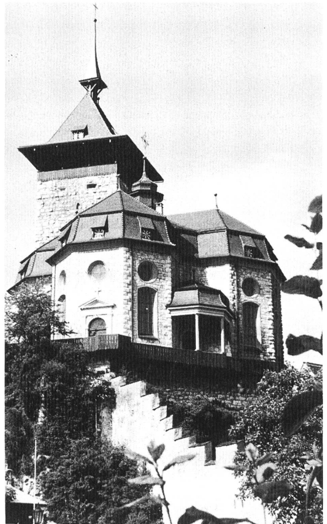
Schlosskirche Niedergösgen vor der Restaurierung.

dings bereits in einem ruinösen Zustand. Ältere Ansichten aus dem 18. Jahrhundert zeigen, dass der Turm von zwei grösseren Gebäuden umgeben war. Das nordöstliche Haus fehlt auf dem Plan von 1892; es war offensichtlich bereits vorher abgetragen worden.