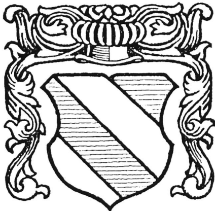
Wappen Hessos von Grenchen. Dreimal schräg rechts geteilt, mit den Farben Silber und Blau.

Hat nun Grenchen heute ein falsches Wappen? Wir glauben nicht; denn ein Wappen muss ein lebendiges Symbol sein.