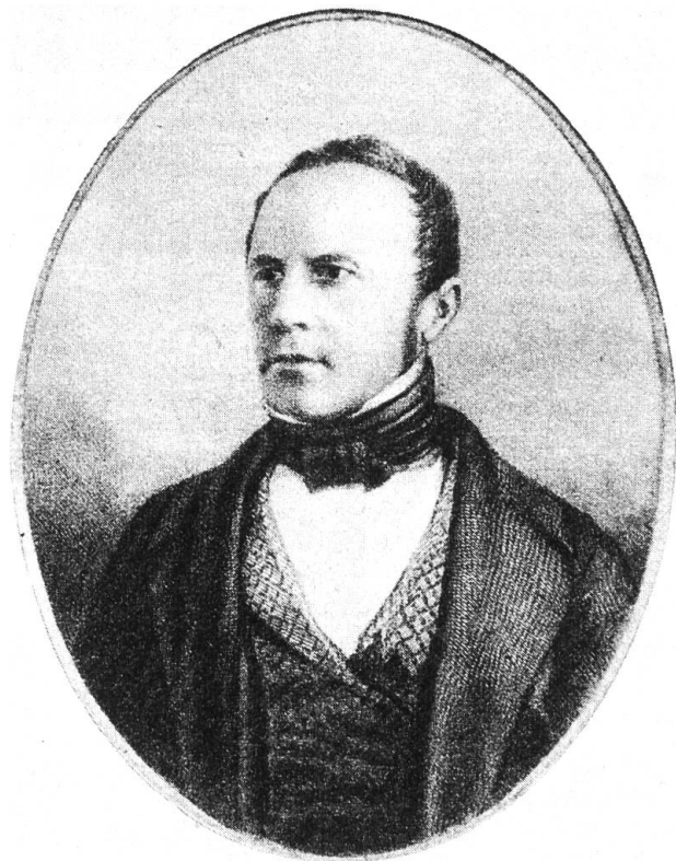
Johann Jakob Speiser (1813–1856).

Josef Munzinger wurde nach der Wahl zum Bundesrat im Jahre 1848 das heikle Finanz-Departement anvertraut. Eine vordringliche Aufgabe war, das Geld für die Startphase des Schweizerischen Bundesstaates zu be-