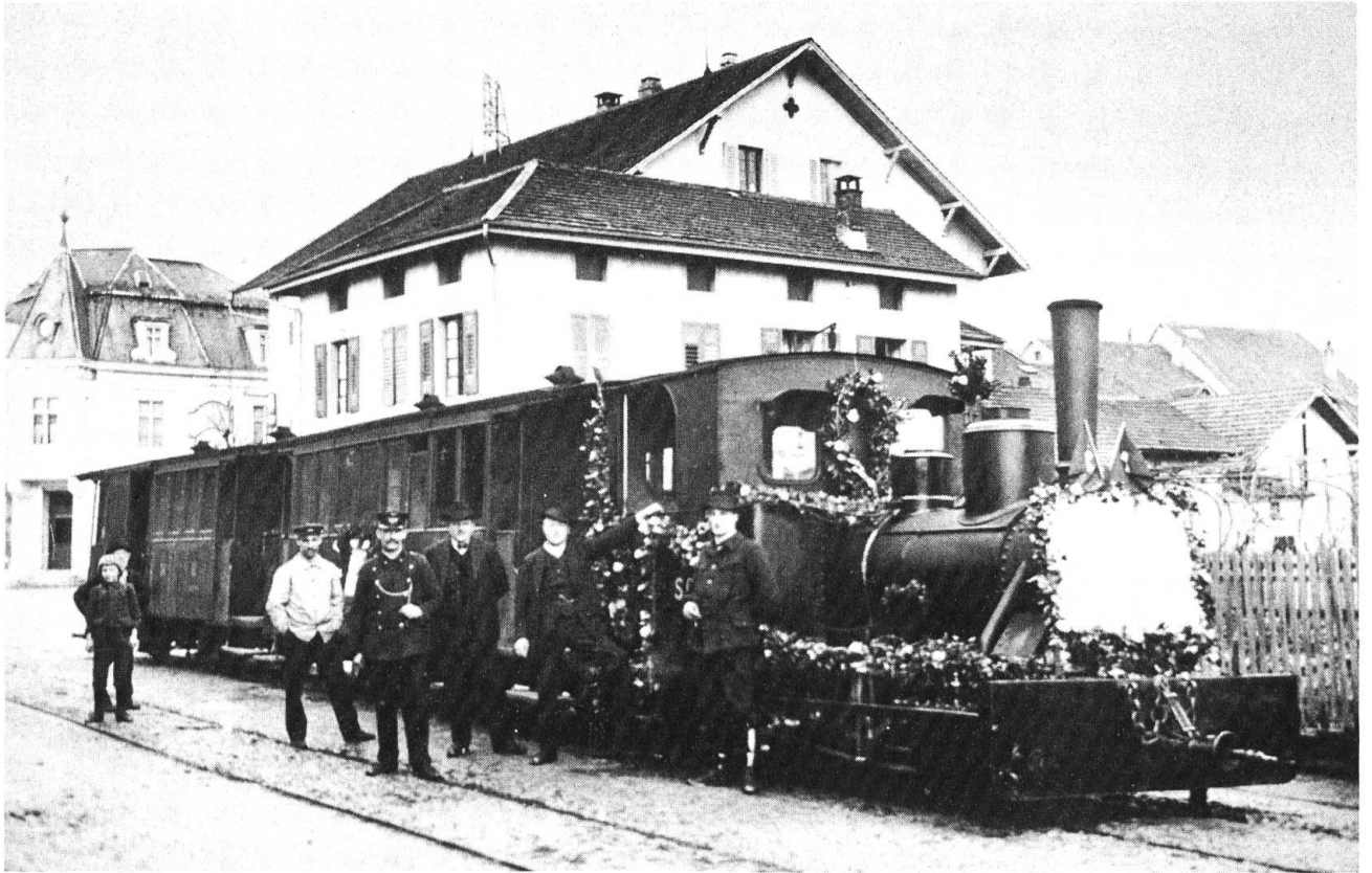
«Heut' rase ich zum letzten Mal..» Die Sissach–Gelterkinden-Bahn auf ihrer letzten Fahrt am 7. 1. 1916.

den im Oberbaselbiet über die Wahl der Linie freuten, mussten sie aber eine merkliche Einbusse bei den Leistungen hinnehmen. Verkehrten bisher 24 Züge, waren es bei den Bundesbahnen nur noch acht pro Tag. Am 7. Januar 1916 verkehrte das «Rutscherli» zum letzten Mal und kündete dies mit einem Spruch an der geschmückten Lokomotive an: