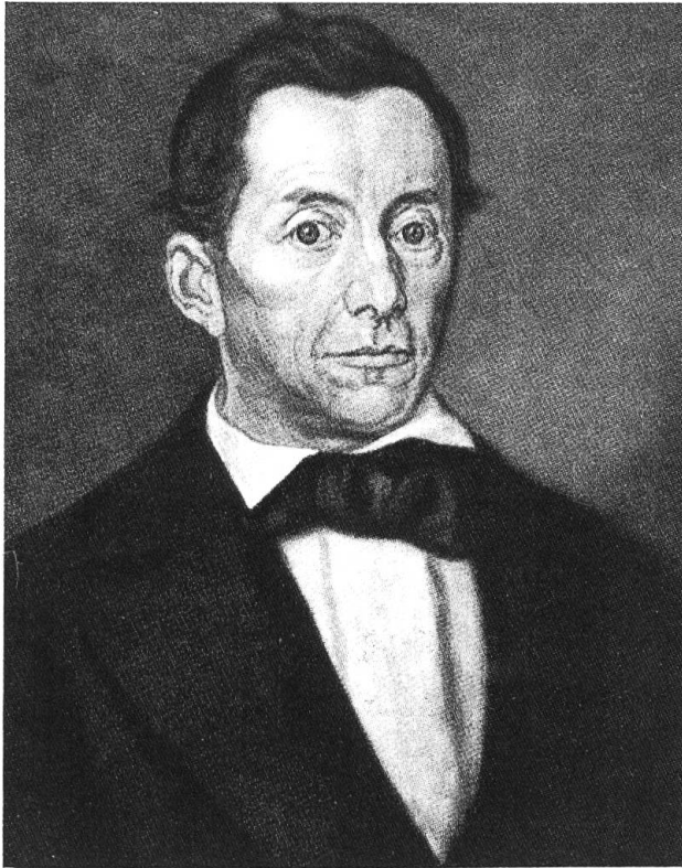
Josef Munzinger (1791–1855).

auch dafür kein Ersatz verlangt. Das bisher der Gesellschaft bereits gelieferte Holz wird ihr geschenkt. Wo sie Land und geeignete Bausteine auf Gemeindeboden antrifft, wird ihr die Ausbeute unentgeltlich überlassen. Soweit in der Eyhalde am Hardkopf Auffüllungsmaterial sich findet, solle es auf Verlangen angewiesen werden. Die Bahngesellschaft wird die Gemeinde bereit finden, billigen Wünschen zukünftig nach Kräften entgegenzukommen.»