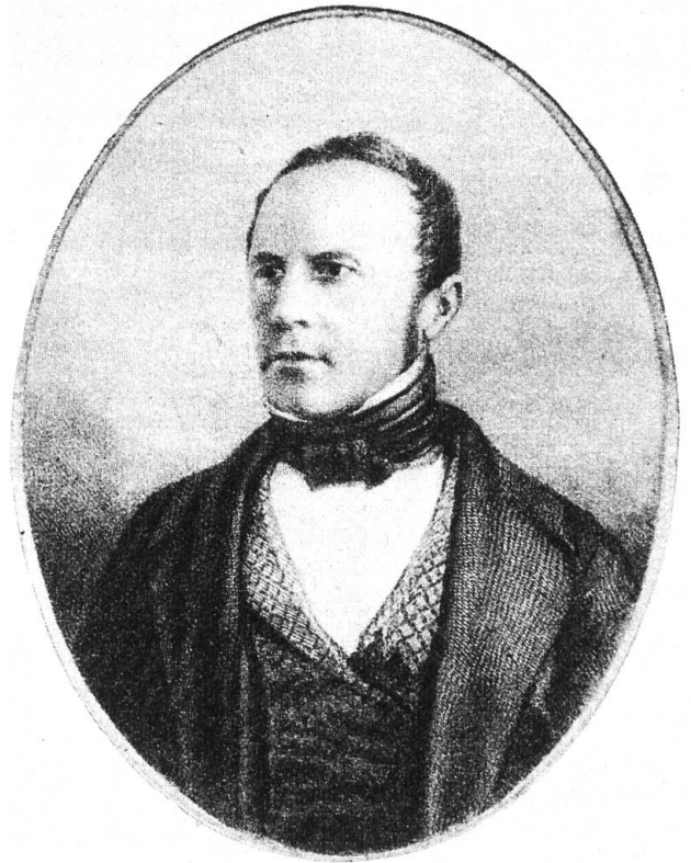
Johann Jakob Speiser (1813–1856).

Josef Munzinger wurde nach der Wahl zum Bundesrat im Jahre 1848 das heikle Finanz-Departement anvertraut. Eine vordringliche Aufgabe war, das Geld für die Startphase des Schweizerischen Bundesstaates zu be-