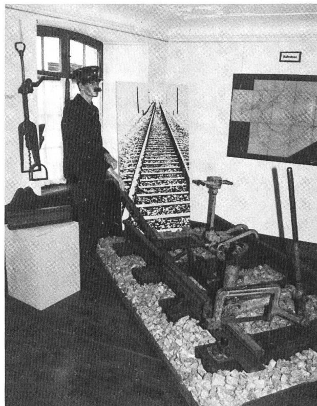
Blick in die derzeitige Ausstellung «100 Jahre Koblenz-Laufenburg-Stein».