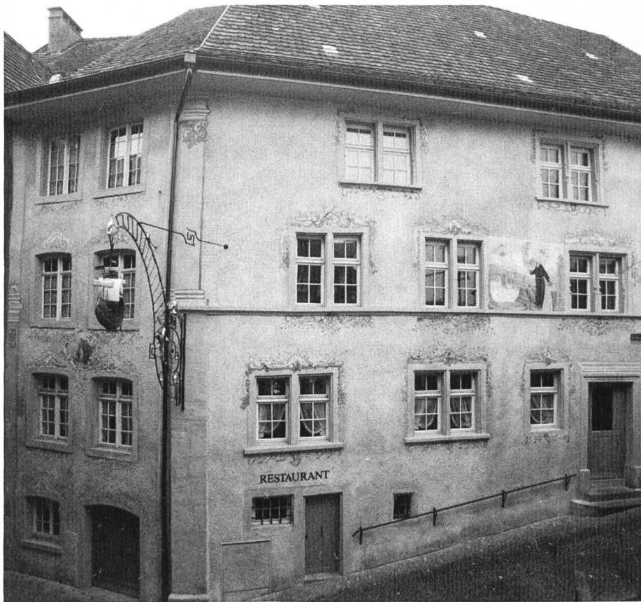
Eckhaus Taverne und Museum «Schiff» mit klassizistischem Wirtshausschild, Grisaille-Malereien an den Fenstereinfassungen, Wandbild (Erweckung eines ertrunkenen Kindes) und kleines Medaillon mit dem heiligen Fridolin.

In der Geschichte des alten Laufener Eckhauses zum Schiff, das 1805 durch Zusammenlegung von zwei im Kern mittelalterlichen Häusern entstanden war, brachte das Jahr 1979 den Beginn einer neuen, glücklichen und hoffentlich lange dauernden Ära. Im Jahre zuvor war der Museumsverein Laufenburg gegründet worden mit dem Zweck, zur Verbreitung der Kenntnisse über die Geschichte Laufens und seiner weiteren Region beizutragen sowie erhaltenswerte Dokumente aller Art aus der Natur-, Sozial-, Wirtschafts- und Kulturgeschichte zu sammeln, zu bewahren und der Öffentlichkeit zugänglich zu machen. Dieser Verein erwarb das Haus, restaurierte es und richtete darin das Museum, dazu eine Gaststätte mit neuer Zunftstube der Narro-Alt-Fischerzunft und Räumen für die Migros-Klubschule ein. Gleichzeitig wurde aus dem