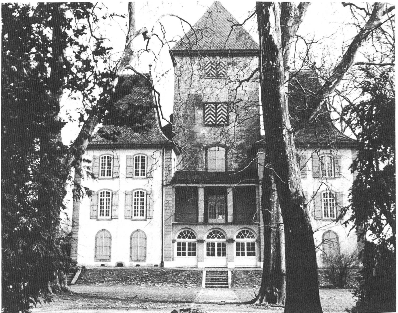
Gleich neben dem RBS-Bahnhof Jegenstorf steht das stolze Schloss mit seinem prächtigen Garten.

In Jegenstorf, einem lebhaften Regionalzentrum, treffen wir auf die Bahnlinie. Gleich neben der Station steht das schmutzige Schloss mit seinem prächtigen Garten. Weiter geht es über Feld und durch Wald nach Grafenried, wo unsere dreistündige Wanderung mit der Rückfahrt im RBS-Zug ihren Abschluss findet. Wer will, kann natürlich noch ein Teilstück nach Belieben anhängen: bis Büren zum Hof, Bätterkinden, Biberist oder gar bis Solothurn.