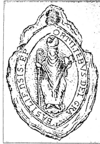
Siegel Ortliebs von Froburg, nach Vautre. (Histoire des Evêques de Bâle 1884).

Der Machtbereich des Basler Fürstbischofs umfasste im Mittelalter nebst grössern Teilen des Jura den Buchsgau, den Frick- und Sissgau und das seit vielen Jahrhunderten wirtschaftlich blühende Oberelsass mit seiner uralten Kultur. Zu diesem