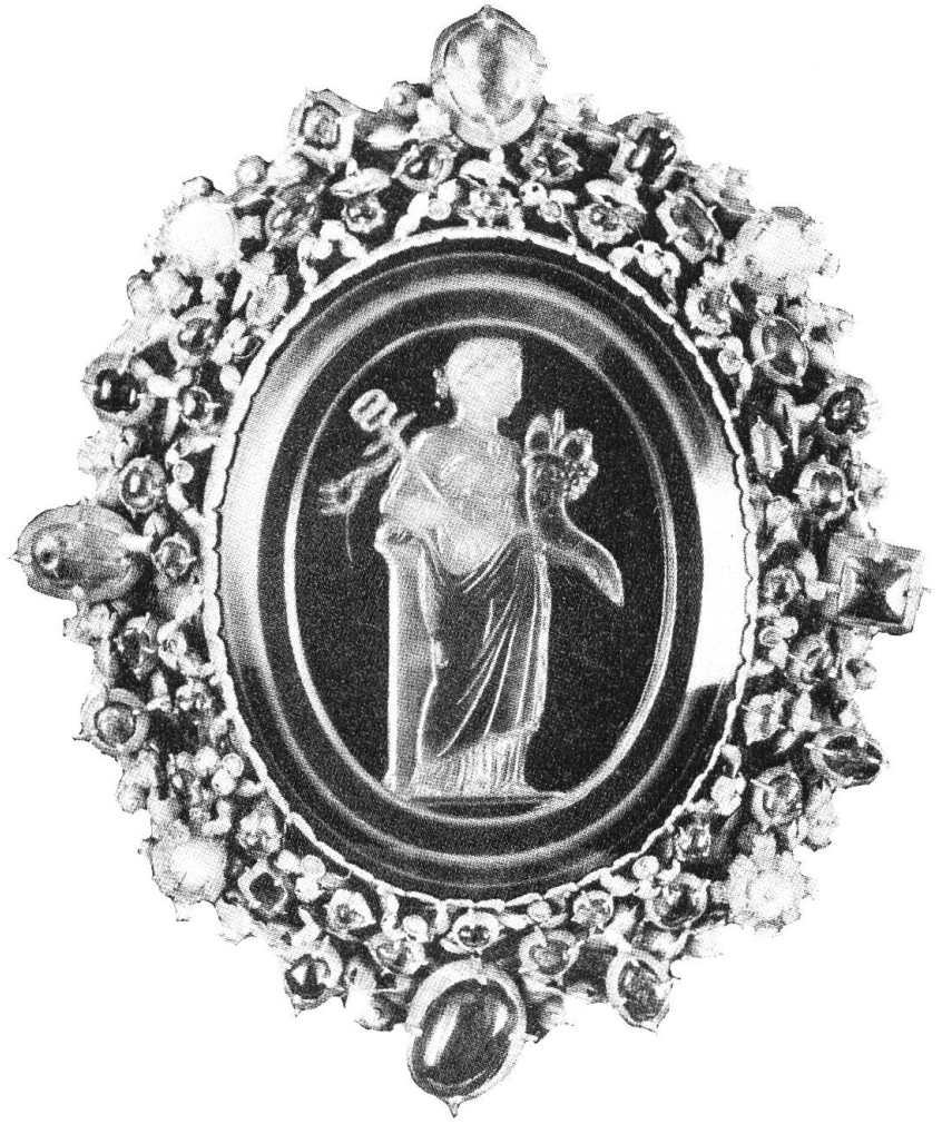
Vorderseite des kostbaren Onyx mit der Frauengestalt im Zentrum, welche die Göttin Pax oder eine Angehörige des augusteischen Kaiserhauses darstellt. Das Schmuckstück erhielt im 13. Jahrhundert eine kunstvoll gearbeitete Fassung.