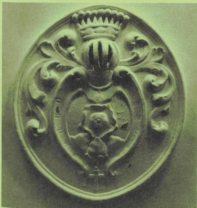
Stuckiertes von Sury-Familienwappen an der Decke des Esssaals im Parterre, 18. Jh.