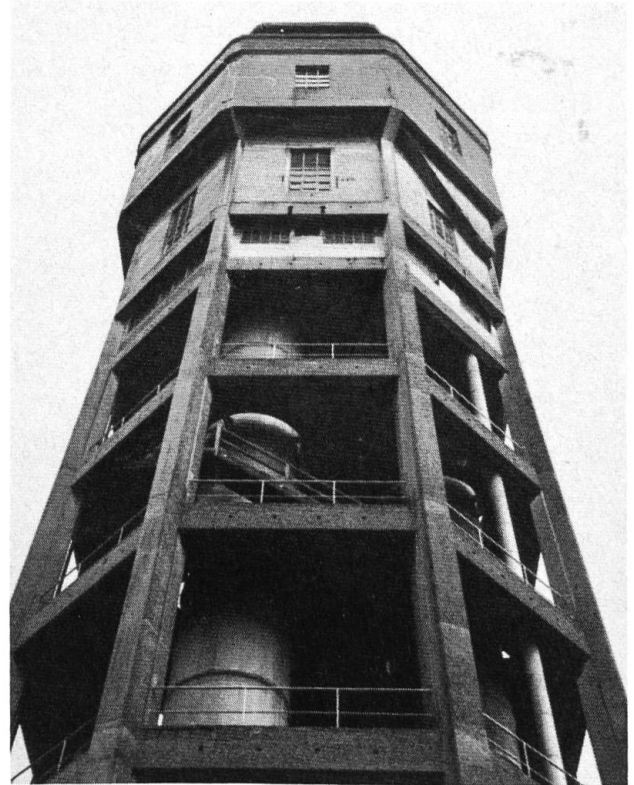
Cellulose-Fabrik Attisholz. Der «Laurenturm».

Ein Lehrpfad versteht sich als Teil einer Landschaft oder eines Menschenwerks mit einer interessanten Vergangenheit oder mit historischen, geographischen, künstlerischen oder architektonischen Eigenschaften, die sowohl für Jugendliche wie auch für andere interessierte Gruppen sichtbar und verständlich sind. Insbesondere sollte ein gut ausgedachter Lehrpfad nach Möglichkeit eine Einheit bilden und ein gewichtiges, nachvollziehbares, umfassendes Thema enthalten.