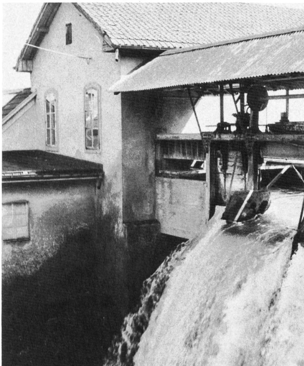
Kammgarnspinnerei Derendingen. Kraftstufe.