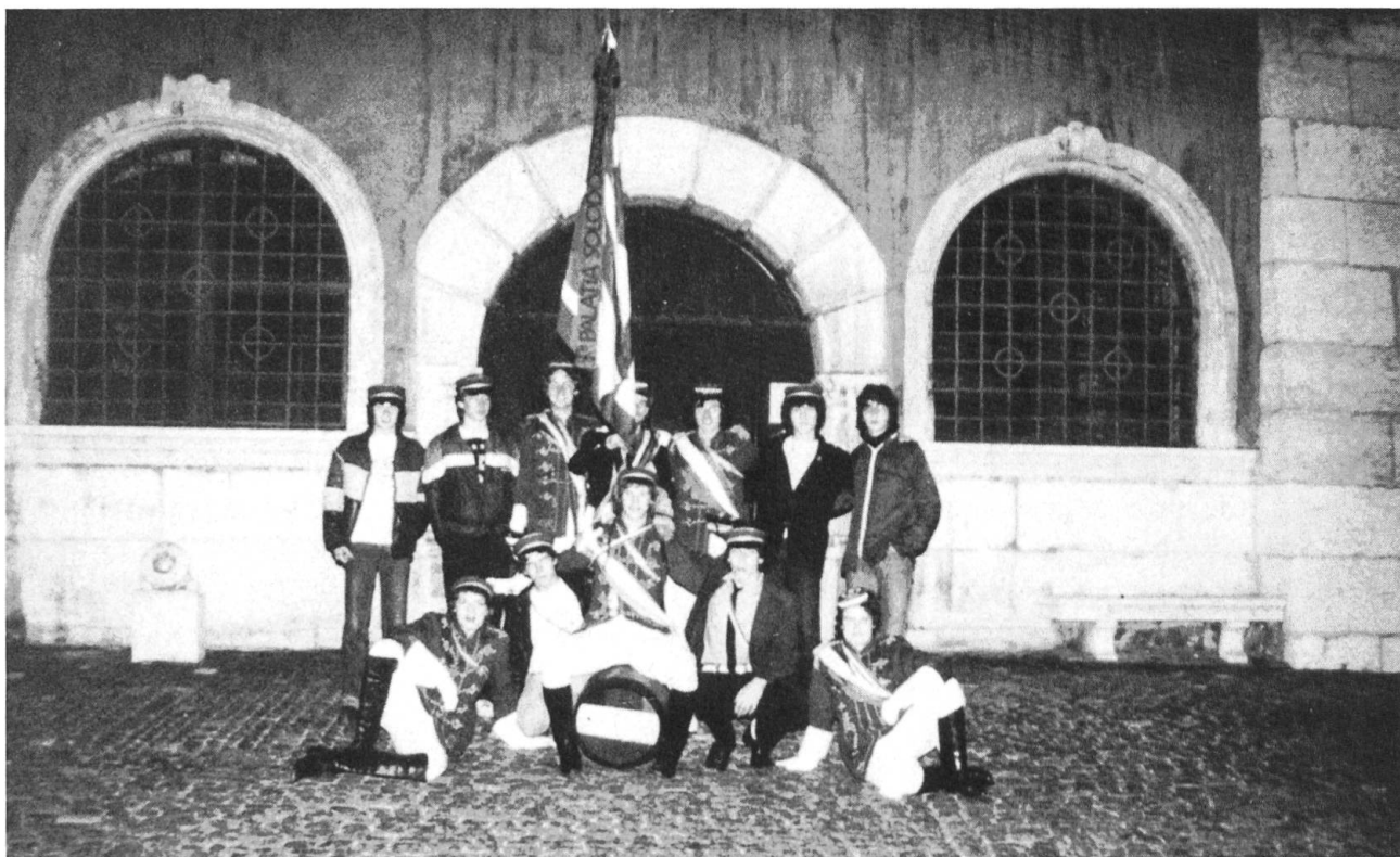
Offizielles Porträt des regierenden Semesters.