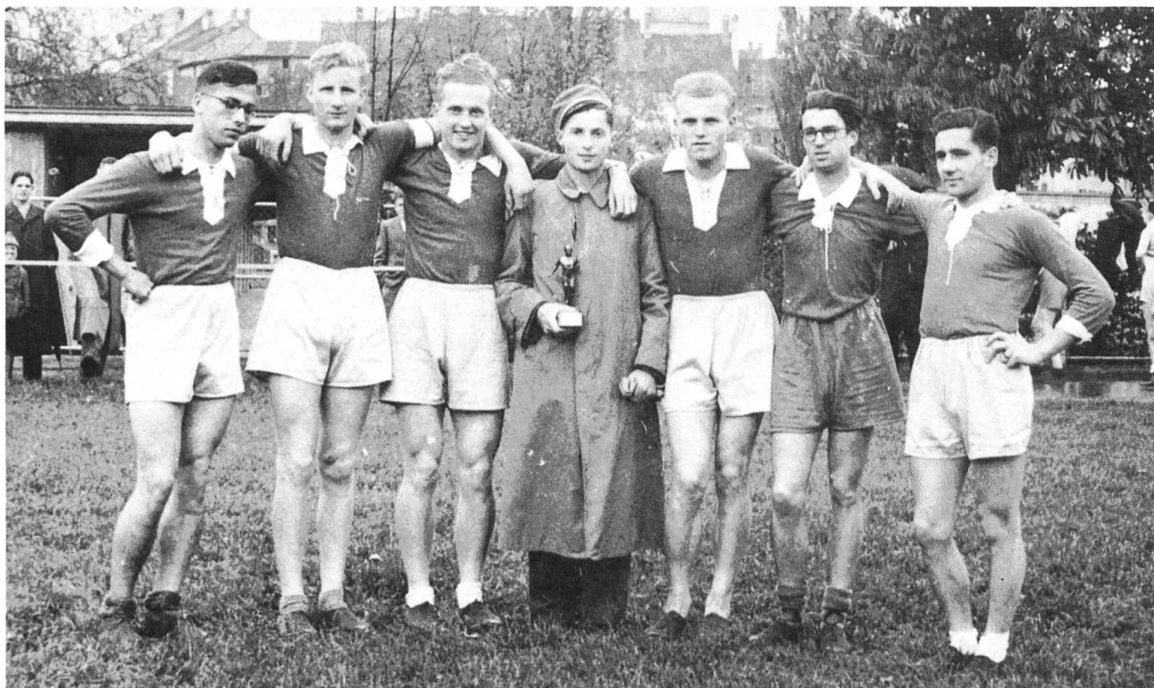
Sieger-Staffel am Quer durch Olten 1939.

Dem Namen AMICITIA — Freundschaft — wird heute noch eifrig nachgelebt. Neben den wöchentlichen Trainings und Stamm treffen sich die AMICITIANER zu vielen weiteren geselligen, aber auch kulturellen Anlässen . So werden nebst studentischen Anlässen auch regelmässig Theaterbesuche und Vorträge organisiert. Die