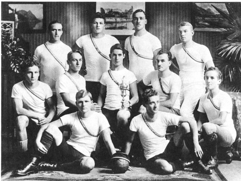
Mannschaft der Amicitia nach ihrem Sieg in der kantonalen Fangballmeisterschaft. Ende der 20er Jahre.