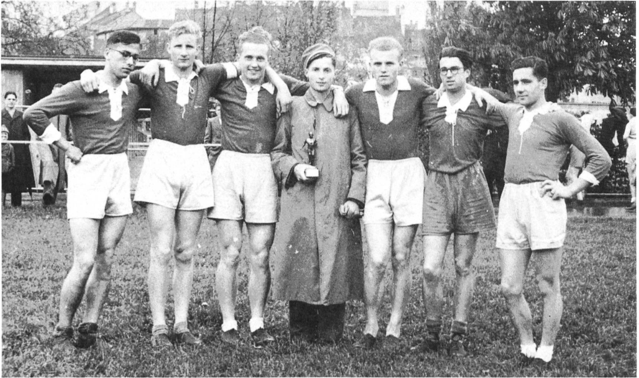
Sieger-Staffel am Quer durch Olten 1939.

Dem Namen AMICITIA — Freundschaft — wird heute noch eifrig nachgelebt. Neben den wöchentlichen Trainings und Stamm treffen sich die AMICITIANER zu vielen weiteren geselligen, aber auch kulturellen Anlässen . So werden nebst studentischen Anlässen auch regelmässig Theaterbesuche und Vorträge organisiert. Die