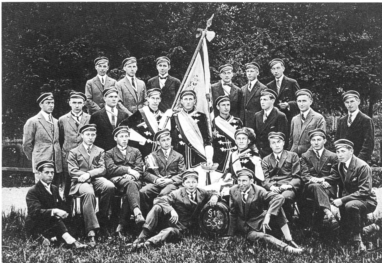
Aktivitas der Amicitia im Sommersemester 1926.