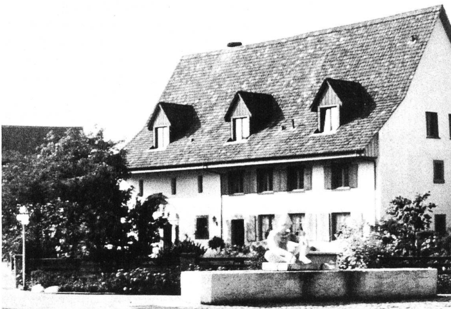
Dorfpartie in Riburg mit dem Narrenbrunnen.

des Reisens zum auswärtigen Arbeitsort müde wurde und nach der Ansiedlung von Industrie am Ort rief, hat man eine Industriezone ausgeschieden und sie erschlossen (auch mit Bahngleisen). Zahlreiche Industriebetriebe verschiedenster Branchen haben sich seither niedergelassen und dazu beigetragen, dass Möhlin heute gegen 2700 Arbeitsplätze aufweist. Weil aber trotz der Nähe dieser Arbeitsplätze immer noch viele Leute ihr Brot in der Region Basel-Pratteln verdienen, kommen täglich auch viele Leute von auswärts in unsere Gemeinde (z. T. aus dem Elsass und dem süddeutschen Raum).