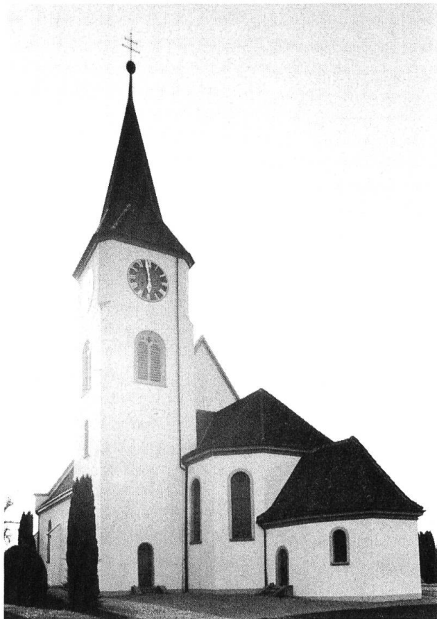
Christkatholische Kirche. Schiff 1607.

Schon im Jahre 346 war im nahem Augusta Raurica ein Bischof ansässig. Der Einzug des Christentums in Möhlin dürfte deshalb relativ früh erfolgt sein. Die erste bekannte Dorfkirche war dem hl. Germanus geweiht. Im Vorhof dieser Kirche wurde eine Schenkungsurkunde ausgestellt und zwar im Jahre 794. Dies ist denn auch die früheste, nachweisbare Erwähnung unseres Dorfes («in atrio sancti Germani, ad villam Melina»). — Später wurde der Kirchenpatron gewechselt zu Bischof Leodegar. Heute noch trägt die der christkatholischen Kirchgemeinde gehörende, hoch über dem Dorf thronende Kirche diesen Namen. Sie hat in den vergangenen Jahrzehnten noch zwei Schwestern (röm.-kath. und reformierte Kirchgemeinde) erhalten. Möhlin heisst, nicht zuletzt der ökumenischen Bestrebungen wegen, auch das «Dorf der drei Kirchen».