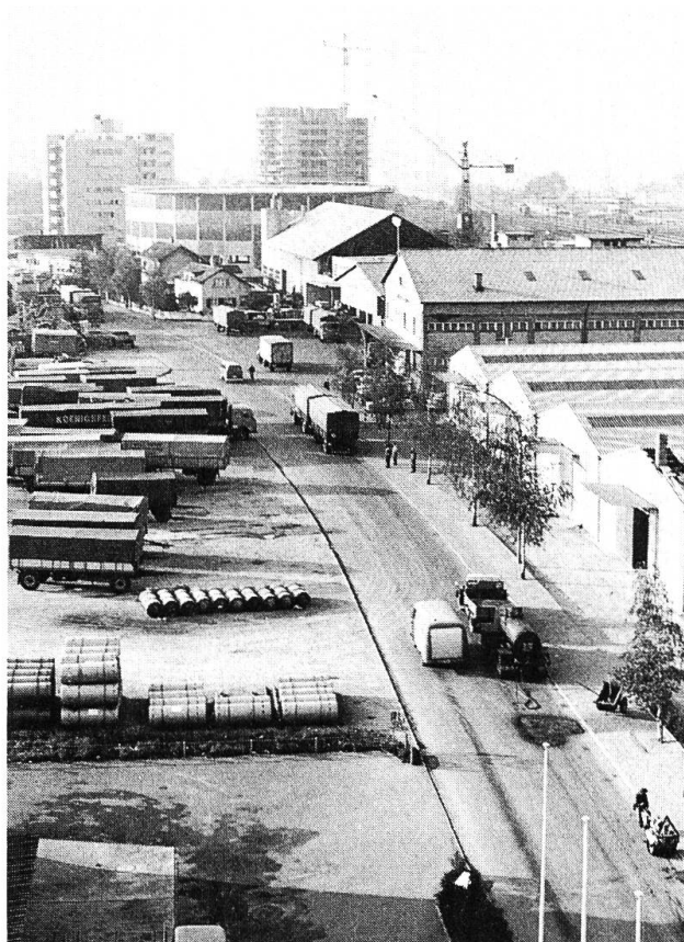
Das Industriequartier Hofacker hat Anschluss an Autobahn und Eisenbahn.

Ermöglicht hat dies vor allem der Umstand, dass die Hauptverkehrszi ge (Strassen, Eisenbahn, Rhein) vom alten Dorfkern entfernt liegen und damit die räumliche Trennung von Wohnquartieren und Industriezonen begünstigten. In den Jahren 1919–1921 entstand an der Grenze zu Basel die Genossenschaftssiedlung Freidorf mit 150 Reihenhäusern und Gärten. Um die gleiche Zeit begann mit dem Bau eines der grössten Rangierbahnhöfe der Schweiz die Ansiedlung von Gewerben und Industrien sowie der Bau der kantonalen Rheinhafenanlagen in der Au. Am Rande dieser Zonen entstanden südwärts Wohnquartiere mit Wohnblöcken und Hochhäusern, während um den Dorfkern herum und am Hang des Wartensbergs vorwiegend Einfamilienhäuser erstellt wurden.