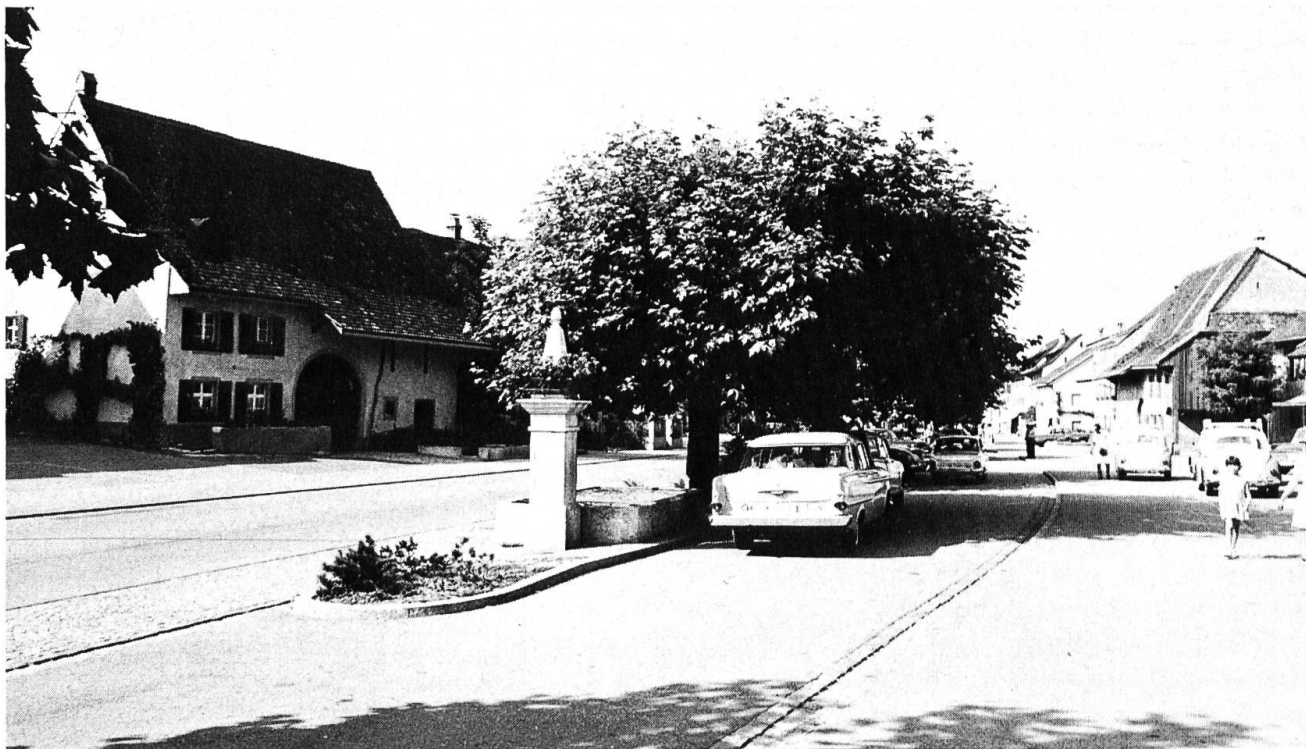
Die MuttENZer Hauptstrasse ist ungewöhnlich breit. Hier floss bis 1921 noch der Dorfbach offen und die grossen Vorplätze der Häuser boten Platz für den Miststock und die landwirtschaftlichen Wagen und Maschinen.