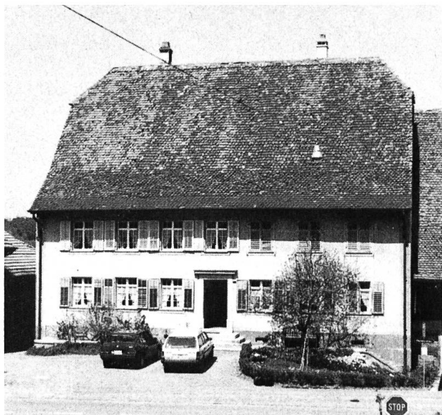
Das Haus Erb.