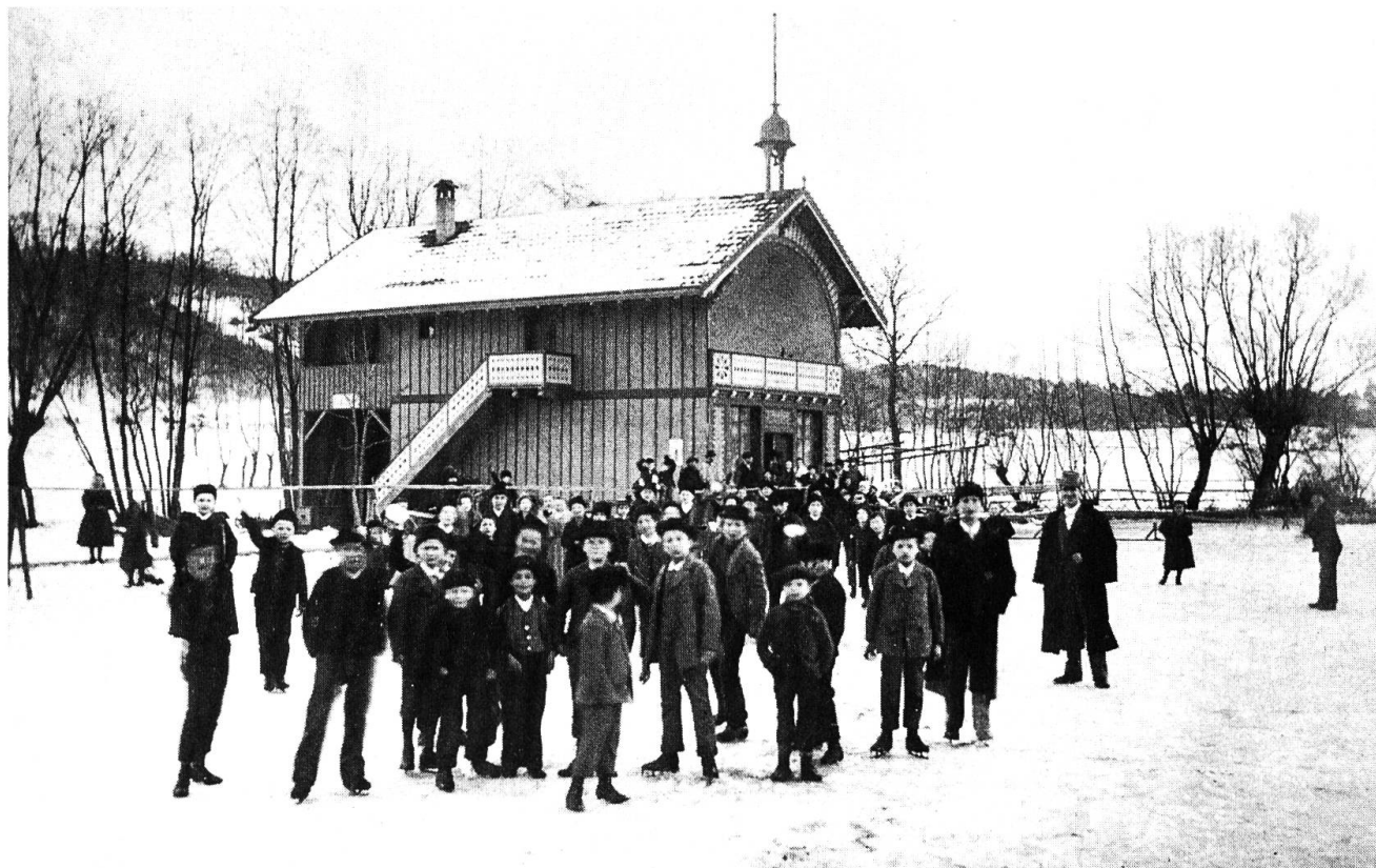
Eisweiher mit Umkleidegebäude. Die Birsigthalbahn, heute BLT, hat den Eisplatz betrieben. Mit der Bahn wurden im Winter die Baslerherrschaften nach Oberwil zum Eislaufen geführt. An Sonntagen, wenn der Weiher gefroren war, spielte eine Musikkapelle zum Eistanzen auf. Der Standort der Kapelle war auf dem Balkon unter dem Pavillonglöcklein. Bei der zweiten Birsigkorrektur 1954 wurde der Weiher mit Aushubmaterial zugeschüttet.

änderungen, Verluste von Bäumen, Abtretung von Gebieten für Wege. Viele Besitzer wollten ihr Land zur Verfügung stellen, um den Mehrbelastungen zu entgehen. Diese Leute sahen wohl, dass eine Regulierung nötig war, fühlten aber den Druck der kritischen Zeit, welche sehr viele Anforderungen stellte, aber dennoch zu wenig Verdienst brachte. Viele Liegenschaften waren stark verschuldet, Zins und Steuern waren nur mit grosser Mühe aufzubringen. Oberwil war lange Zeit eine sehr arme Bauerngemeinde.