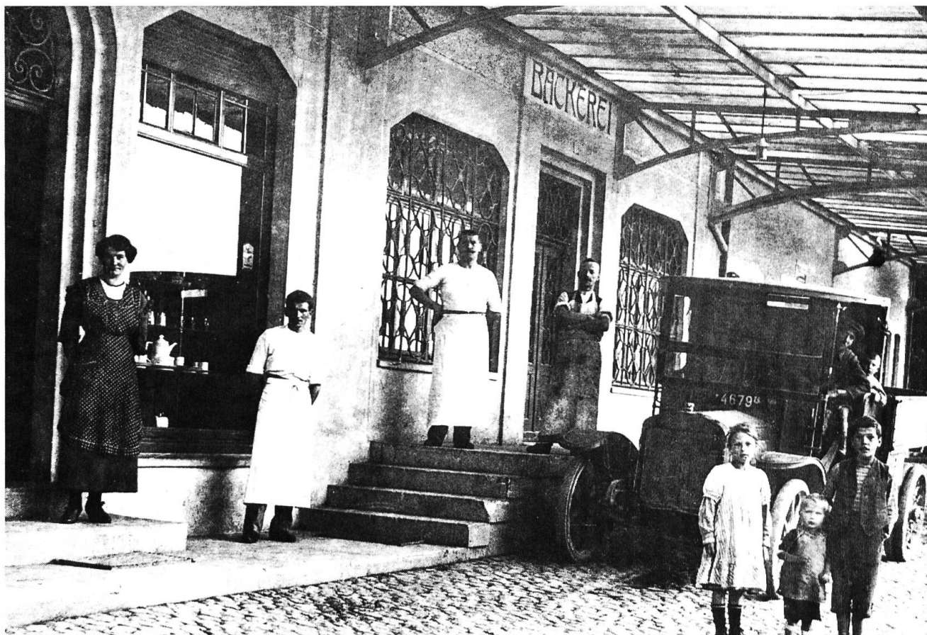
Ursprünglich wurde diese Fabrik im Jahre 1878 zur Bierherstellung gebaut. Später etablierte sich der Consumverein mit der betriebseigenen Bäckerei. Zuletzt war eine Sackfabrik untergebracht; zwischen 1970 und 1980 wurde die Sackfabrikation eingestellt. An die Brauerei erinnert noch das umliegende Gebiet mit dem Namen Brauiquartier.

derregulierung; damals wurden drei Parzellen miteinbezogen. Weitere Meliorationsarbeiten bzw. Bodenverbesserungen folgten im Vorder- und Hintersenn sowie im Ropperhag im Jahre 1929.