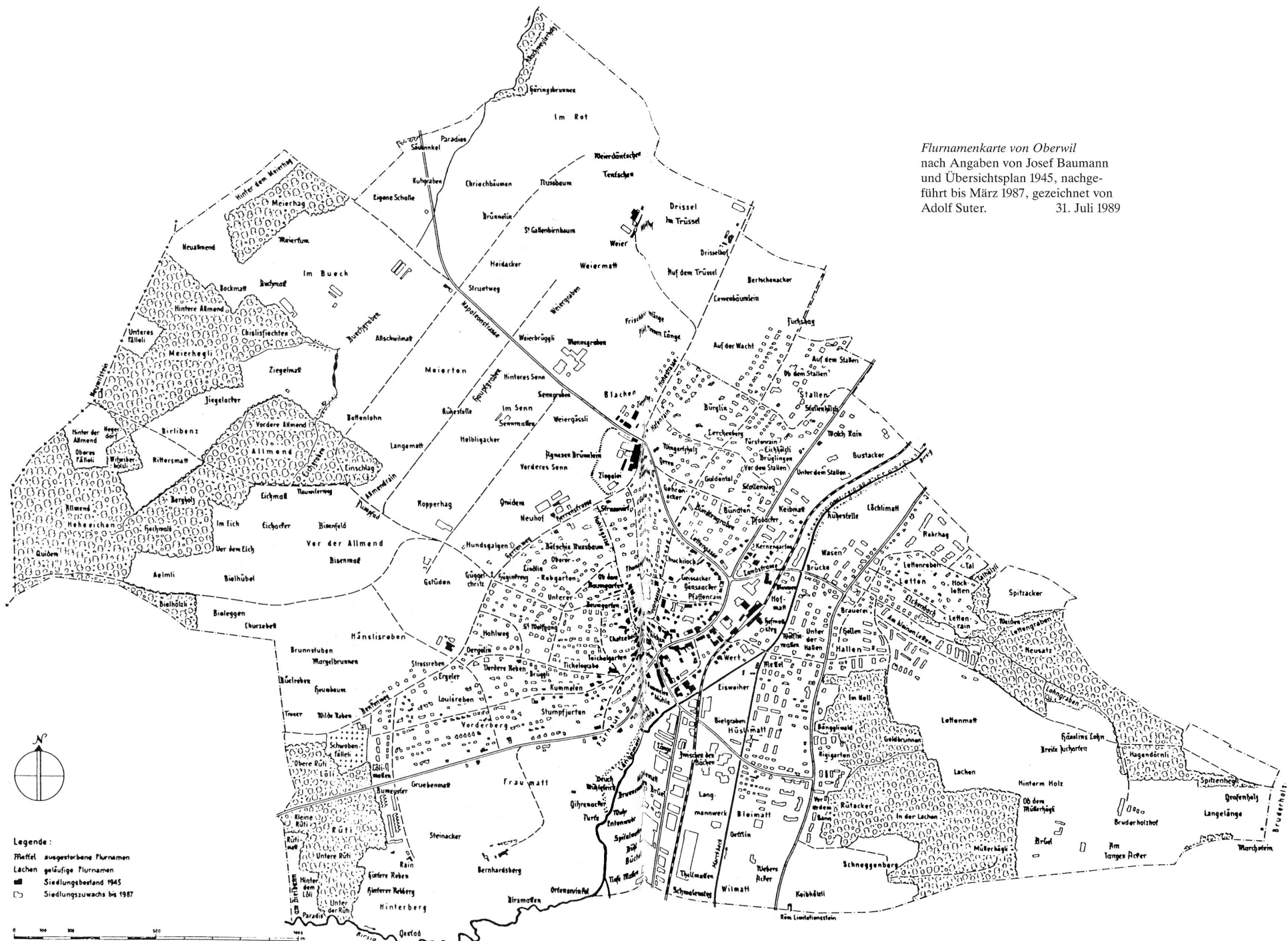
Flurnamenkarte von Oberwil nach Angaben von Josef Baumann und Übersichtsplan 1945, nachge- führt bis März 1987, gezeichnet von Adolf Suter. 31. Juli 1989