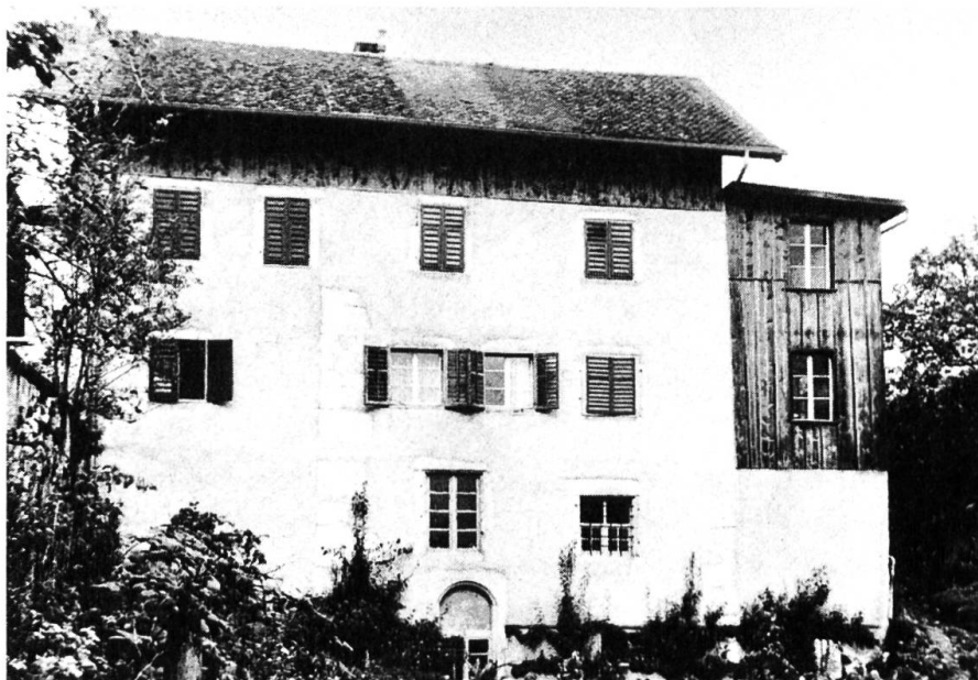
Die Mühle von Süden mit den späteren Anbauten links und rechts.

untereinander verbunden. Platzgründe riefen im späten 19. Jahrhundert einem Anbau aus Backstein mit geräumigen Holzlauben auf der Ostseite der Mühle. Durch diese Lauben führt jetzt der Aufgang ins oberste Stockwerk und von dort in den Estrich. Der Dachstuhl trägt die Jahrzahl 1693. Unter dem Anbau Ost fliesst, überdeckt und unsichtbar, der Mühlebach, eingebettet in Kalksteinquadern, in tiefem Graben zur Aare.