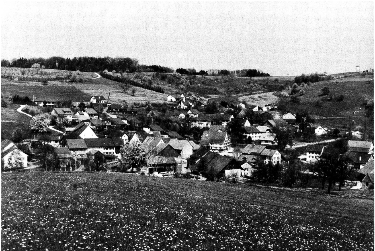
Olsberg aus Südwesten.