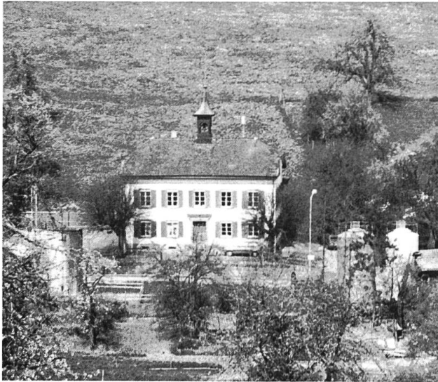
Schul- und Gemeindehaus.

geschoben werden. Die Gemeinde erstellte unterhalb des Stifts eine mechanisch-biologisch arbeitende Kläranlage. Mit der Verlegung von Abwasserleitungen wurden gleichzeitig veraltete Trinkwasserleitungen ersetzt, die Hydrantenanlage erweitert und die Verkabelung der Elektrizitätsversorgung vorgenommen. Nach diesen aufwendigen Realisierungen wurden die Dorfstrasse schrittweise ausgebaut und mit Asphalt belegt. In jüngerer Zeit verschwanden zunehmend, aus Gründen des Unterhaltes, Naturwege und -strassen unter einer Teerschicht.