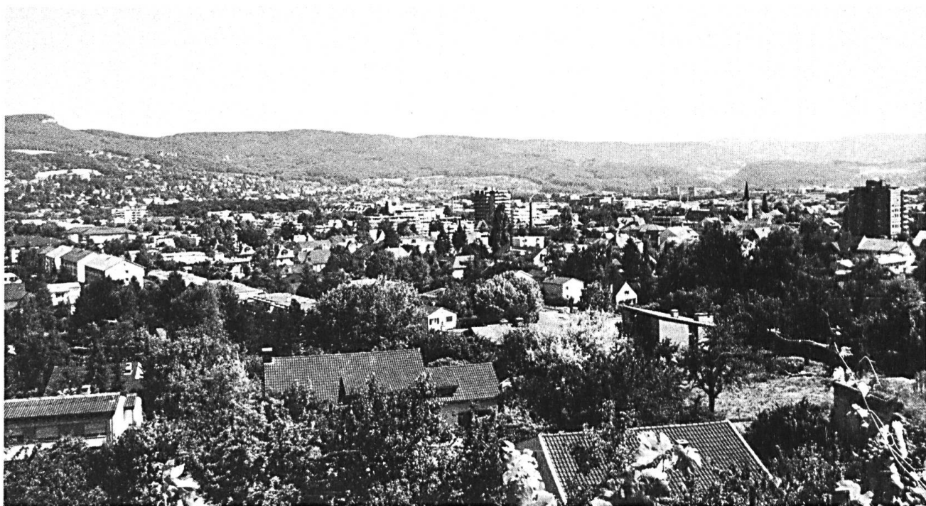
Reinach ist heute die bevölkerungsmässig grösste Gemeinde des Birsecks.