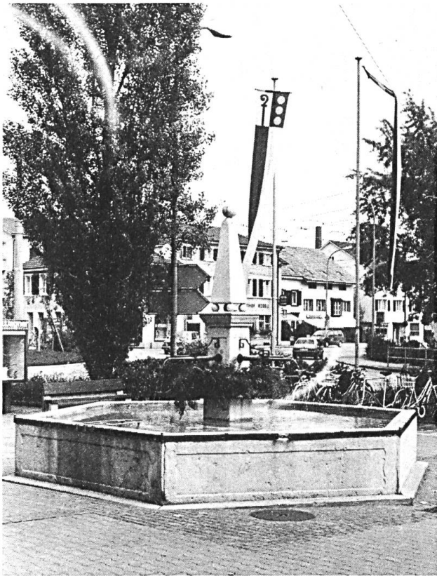
Der Dorfbrunnen bildet auch im modernen Reinach einen Mittelpunkt. Im Hintergrund eine Flagge mit dem Reinacher Gemeindewappen.

weise erforderte für die Erschliessung mit Wasser und Elektrizität und später auch für die Kanalisation weit grössere Aufwendungen als Erträge durch die Anschlüsse erzielt werden konnten. Auch litt das Siedlungsbild. Die Gemeinde selber trug zu dieser Zersiedelung das ihre bei, indem sie 1925 das ganze Gebiet der Feldregulierung II, die Gebiete nördlich und östlich des Dorfes bis an die Grenze der Gemeinde Münchenstein umfasste, in den Baulinienplan einschloss. Die gewerblich-industrielle Entwicklung aber stagnierte, wenn sich auch einige neue Gewerbebetriebe ansiedelten. Die Gemeinde förderte zwar verschiedene Projekte, doch wurden kaum Ergebnisse von weittragender Bedeutung erzielt.