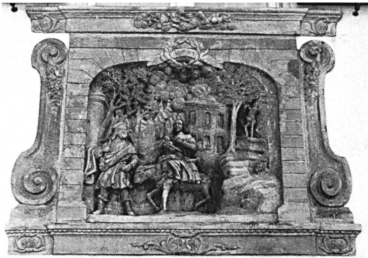
Das Relief am Kury-Haus an der Hauptstrasse (heute Raiffeisenbank) hat Niklaus Kury 1752 geschaffen und stellt die «Flucht nach Ägypten» dar.

1504–1511 hin, weil der Pfarrektor von Pfeffingen um einen grossen Teil seiner Einnahmen fürchtete. Im Sinne eines Kompromisses wurde Reinach 1511 die Bildung einer eigenen Pfarrei erlaubt, es musste aber weiterhin die bisherigen Abgaben nach Pfeffingen entrichten und die eigene Pfarrei zusätzlich finanzieren. Um sich eine finanzielle Basis für die eigene Pfarrei zu schaffen, verkaufte Reinach einen Teil seines Waldes auf dem Bruderholz an das Predigerkloster in Basel, weshalb dieser Teil der Waldungen bis heute den Namen «Predigerholz» trägt.