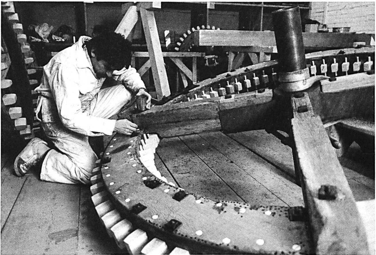
Restaurierung der Anlage im Atelier in Bern. Mit viel Handarbeit werden die einzelnen Werkstücke restauriert und wo nötig erneuert.

In einem nächsten Schritt ist ein bis ins Detail massstabsgetreues und funktionsfähiges Modell (Massstab 1:10) gebaut worden, welches ermöglichte, die Funktionsabläufe des Triebwerks zu sehen und zu verstehen. Mit dem Modell entstand der Wunsch aller Beteiligten, die Mühleeinrichtung nicht nur als lebloses Museumsobjekt zu konservieren, sondern wieder betriebs- und produktionstüchtig zu machen.