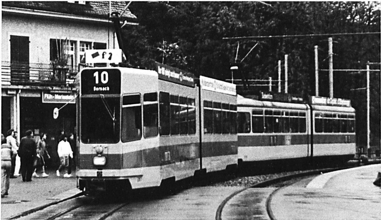
Die neue Zeit – Linie 10 zwischen Dornach und Rodersdorf.

den sprach das Ministerium in Strassburg der Basler Bahngesellschaft zu. Mit dieser Beihilfe fiel es der Direktion leichter, den rebellierenden Leimentalern nachzugeben, wenigstens vorläufig.