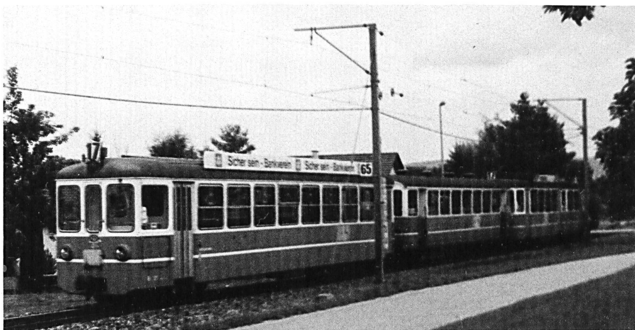
Die letzten Tage der blauen Bahn.

Von all dem blieb, nachdem die Bahn um 1905 elektrifiziert worden war, die Verlängerung von Flüh über das elsässische Leymen nach Rodersdorf. Mit vielen Festlichkeiten wurde das neue, internationale Teilstück am 1. Mai 1910 eröffnet. Weil der Ausbau aber recht teuer war, erhöhte die Direktion die bisher günstigen Abonnementspreise, die übrigens schon damals nicht kostendeckend waren. Die Kunden wollten jedoch den Mehrpreis nicht akzeptieren; sie liessen die Bahn leer fahren und stiegen für ihren Arbeitsweg aufs Fahrrad, aufs Pferd oder auf den Wagen um. Hilfe brachte der geplagten Bahn das damals zum Deutschen Reich gehörende Elsass-Lothringen; immerhin 15 000 Mark pro Bahnkilometer auf Elsässer Bo-