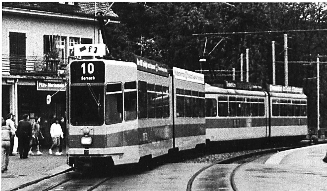
Die neue Zeit — Linie 10 zwischen Dornach und Rodersdorf.

den sprach das Ministerium in Strassburg der Basler Bahngesellschaft zu. Mit dieser Beihilfe fiel es der Direktion leichter, den rebellierenden Leimentalern nachzugeben, wenigstens vorläufig.