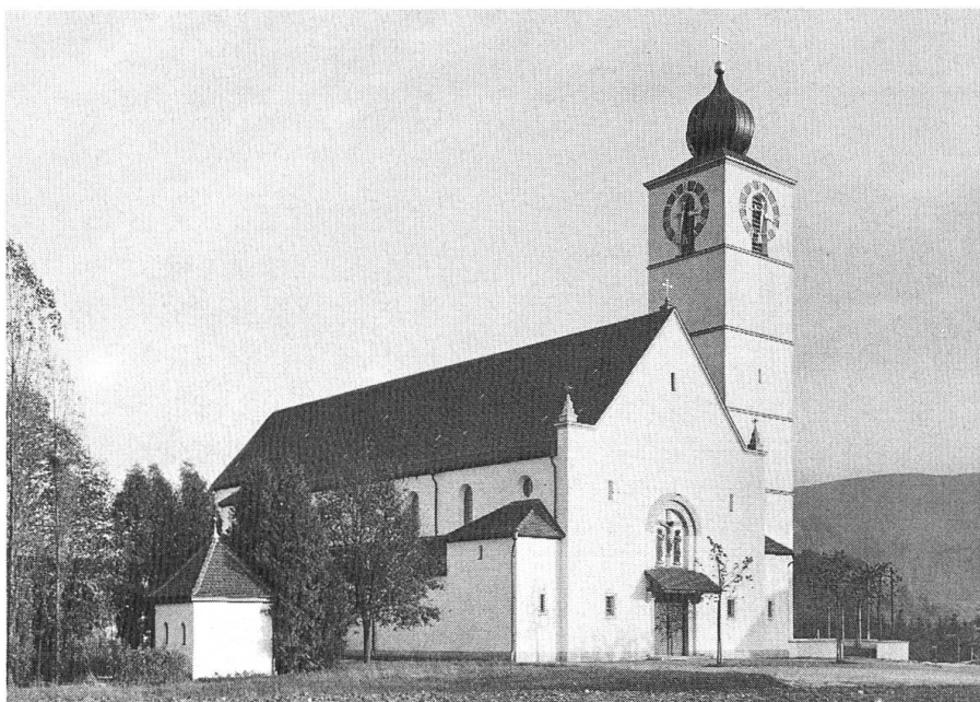
Münchenstein/Neuwelt. Katholische Kirche-Neubau 1933.