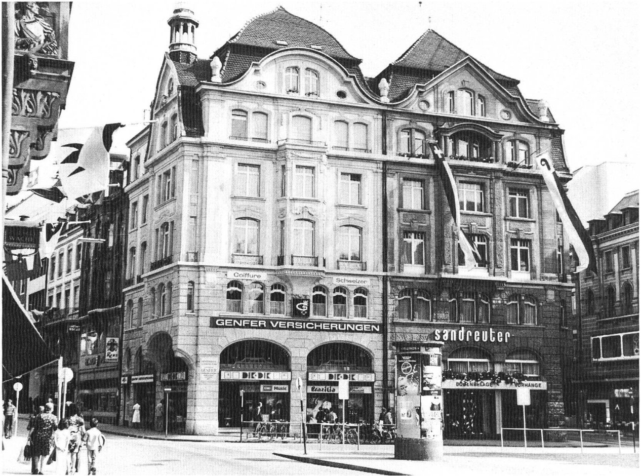
Marktplatz, Häuser «zum roten Turm» und «zur Laute» (Foto: Rolf Brönnimann, Basel).

1902 entsteht, wieder in Zusammenarbeit mit Stehlin, die neobarocke Musikschule an der Leonhardsstrasse (heute Musikakademie).