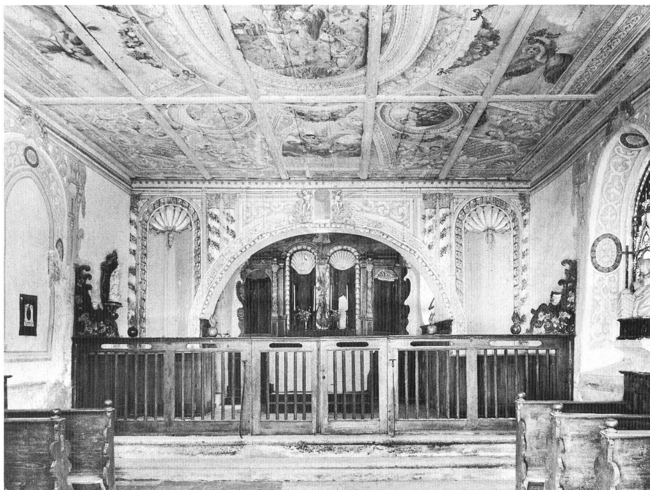
St. Martinskapelle in der Einsiedelei, Solothurn. Wir gaben einen Beitrag an die Restaurierung der Deckenmalereien.

Aus dem oben Gesagten wird klar, dass der Heimatschutzgedanke sich in manchen Belangen geändert hat. Eine Verlagerung hat es auch bei den früher im Vordergrund stehenden Aufgaben gegeben, seit in den letzten Jahrzehnten die staatlichen Denkmalpflegen diese übernommen haben und sie dank gesetzlicher Grundlagen wirksam wahrnehmen können.