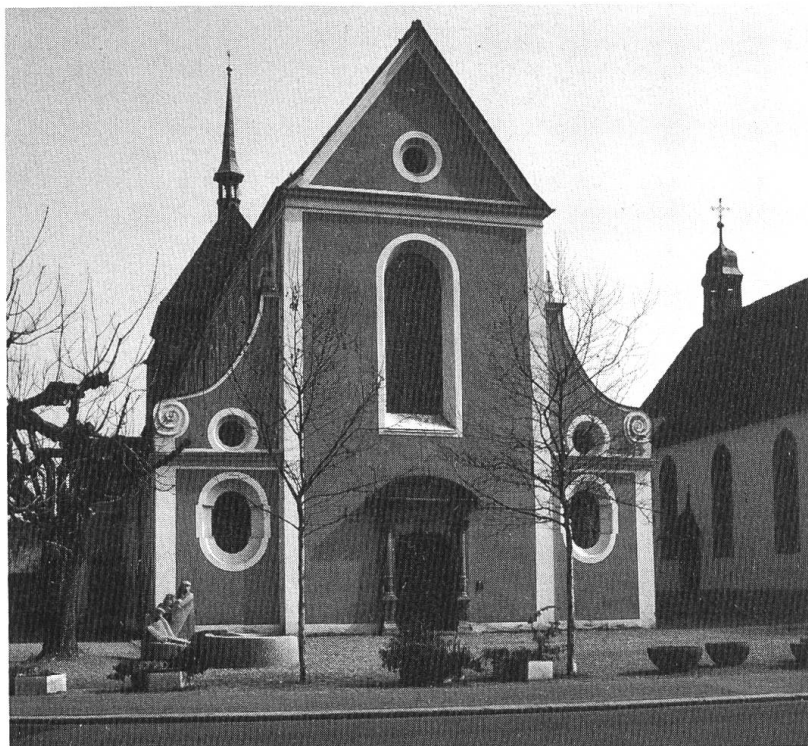
Zurzach, St. Verena, Ansicht von NW.