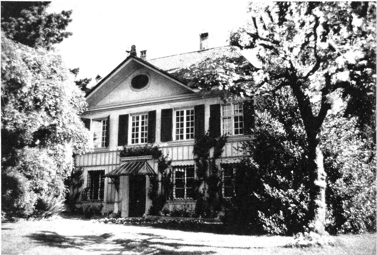
Der Loretohof an der Florastrasse in Solothurn.