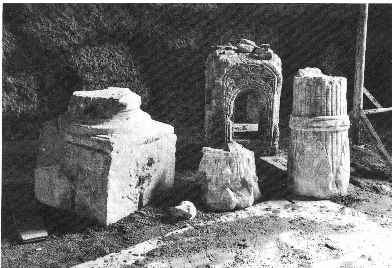
Die Teile des Lichthäuschens nach dem Ausbau.