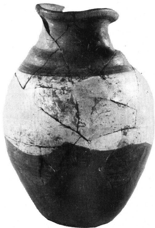
Flasche, bemalte Feinkeramik, Fehlbrand (aus Grab 113).

eingeführt, die auch die überaus vielfältigen Gefäßformen genau unterscheidet (so z. B. 9 Typen von Kochtöpfen mit 29 verschiedenen Randformen). Den Hauptteil bildet der Katalog mit 175 Tafeln mit über 2400 Abbildungen — eine imponierende Dokumentation. Die stets in Sichtverbindung mit den Abbildungen gebotenen Informationen umfassen in übersichtlicher Darstellung 10 Rubriken. Im 3. Teil helfen uns verschiedene Verzeichnisse und Konkordanzen, uns in der gewaltigen Fülle der Objekte zurechtzufinden.