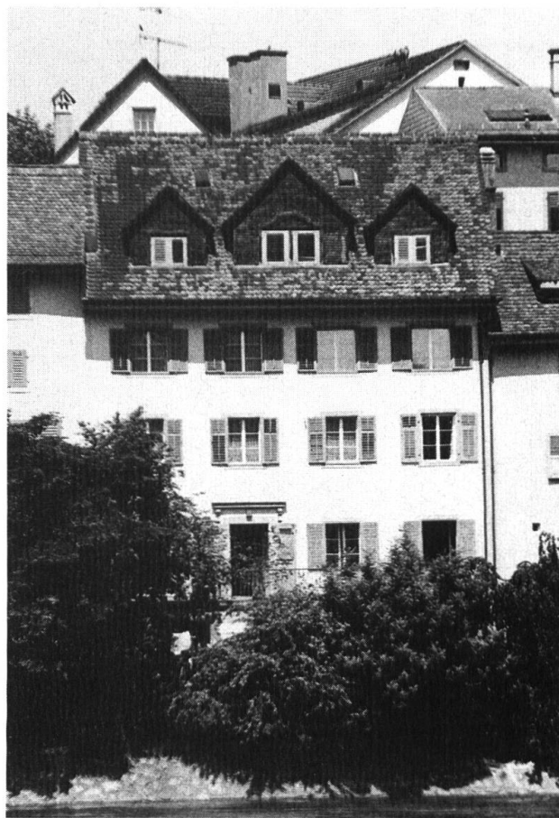
Das erste Schulhaus der Stadt. Aufnahme 1979.

Seit wann aber diente das Frühmesserhaus als Schulhaus? Die Quellen darüber sind spärlich. Dass es in Olten eine Schule gibt, geht erstmals aus den Ausgabenbelegen für das Jahr 1542 hervor, wo ein Posten von 4 Batzen ausgewiesen ist, der den Schülern zu Fronleichnam zustand 8 . Laut einem