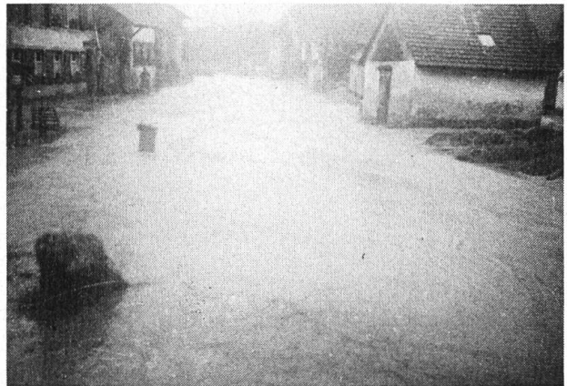
Buchhüsli im Unterdorf. Hochwasser 6. Juli 1948.

Über die Gründung der Waschhaus-Gesellschaften ist heute nichts mehr bekannt und auch in alten Handschriften war nichts ausfindig zu machen. Interessant ist die Tatsache, dass alle vier Waschhausgenossenschaften verschiedene Statuten kannten, das heisst, dass jedes Buchhüsli selbständig verwaltet wurde. Nicht alle Einwohner hatten das Recht in den Buchhüsli zu waschen. Das Waschrecht war vorwiegend den Mitgliedern der Waschhausgenossenschaften vorbehalten. Nichtmitglieder konnten zwar in Ausnahmefällen waschen, mussten dafür aber höhere Waschgebühren bezahlen. Das Waschhausrecht war teils erblich, da es mit den Häusern der Genossenschafter verbun-