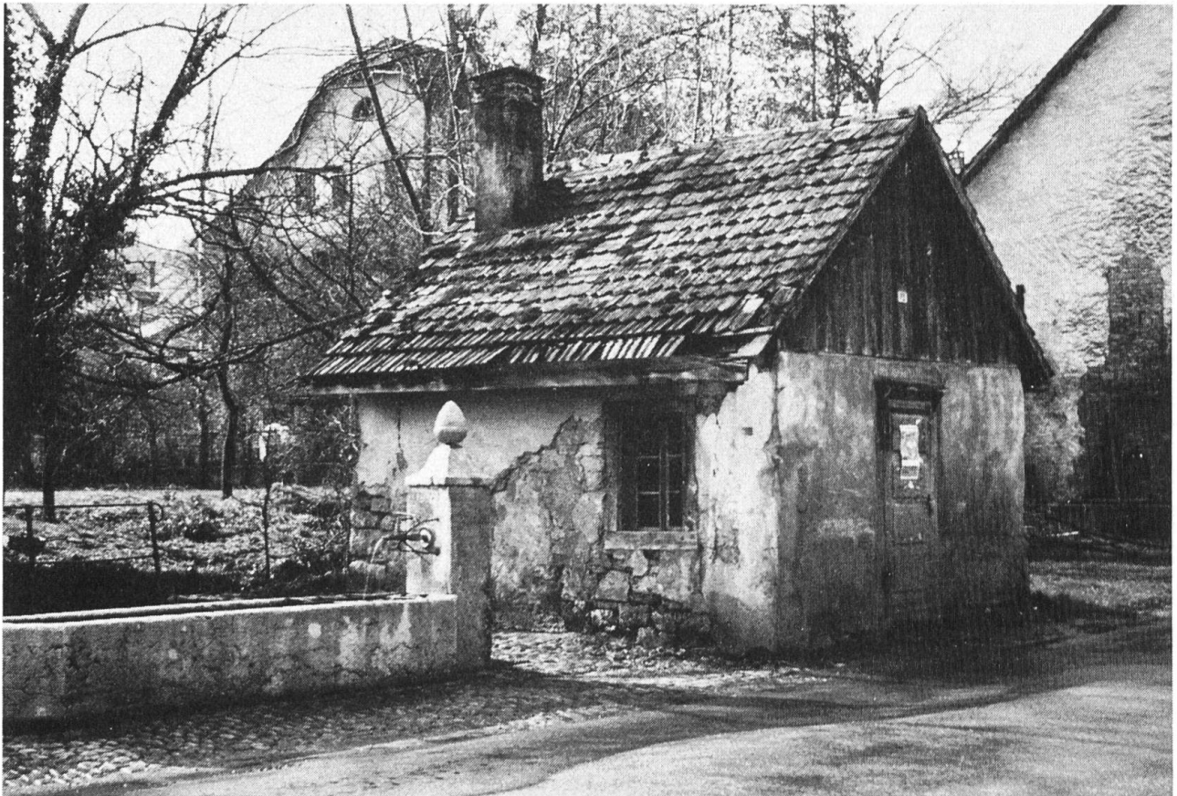
Buchhüsli im Unterdorf, vor der Renovation 1979.

gebühren einziehen und waren ganz allgemein für das ganze Kassawesen zuständig. Mussten wichtige Beschlüsse gefasst werden (etwa Reparaturen, Neuanschaffungen), so wurden Versammlungen einberufen. Es fanden nicht bei allen Buchhüsli-Genossenschaften alljährliche Versammlungen statt, sondern je nach Bedarf in unterschiedlichen Abständen.