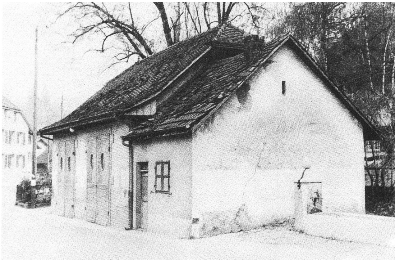
Waschhaus und Spritzenhaus im Mitteldorf, kurz vor dem Abbruch 1976.