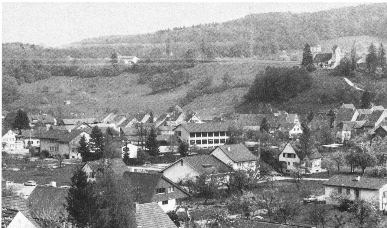
Ziefen 1979. Blick vom Bockmätteli gegen die Kirche. In der Mitte das neue Mehrzweckgebäude.