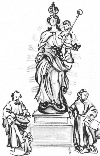
Seewen: Die Figuren aus dem «Chäppeli unter der Holle» — Maria vom Siege und die Evangelisten Matthäus und Johannes — warten auf eine fachmännische Pflege mit Hilfe des HS.

Besonders erwähnt sei hier das Haus Baslerstrasse 255 in Trimbach , dessen Aussenrestaurierung mustergültig ausgeführt worden ist. Die Presse nahm mit Beifall Notiz und veröffentlichte Fotos von der sehr schönen Fassade der Liegenschaft. In den Bildlegenden fand jeweils die Kostenaufteilung zwischen Besitzer und Denkmalpflege Erwähnung, jedoch wurde die finanzielle Beteiligung des Heimatschutzes leider verschwiegen. Zweifellos war dies nicht Absicht, viel eher eine versehentliche Unterlassung. Aus diesem Grunde und zur Orientierung unserer Mitglieder, weisen wir an dieser Stelle ausdrücklich auf unsere Mitwirkung an der Finanzierung dieses glückten Vorhabens hin. Da die erwähnte Liegenschaft Teil einer dreigliedrigen, unbedingt erhaltenswürdigen Häusergruppe ist, hoffen wir, die beiden andern Gebäude (Restaurant «Schmiede») mögen ebenfalls in naher Zukunft einer fachgerechten Restaurierung unterzogen werden.