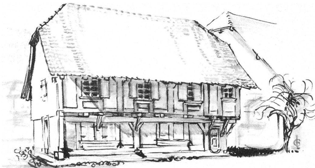
Boningen: Tanzhäuschen, das letzte im Kanton, das mit Hilfe des HS erhalten werden konnte.

welchem Fall der Regierungsrat auf Beschwerde des Heimatschutzes erstmals klar seine wichtige Prüfungspflicht umschrieben hat. Die Nutzungsplanung enthält die Zonen- und die Erschliessungsplanung. Die Zonenplanung unterteilt das Gebiet in Siedlungsgebiet und Schutzzonen, das Siedlungsgebiet in Bauland und Reservegebiet. Dem Heimatschutz im besondern dient die Vorschrift, wonach die Gemeinden Schutzzonen namentlich für Ortsbilder, historische Stätten, Natur- und Kulturdenkmäler, Gebiete von besonderer Schönheit und Eigenart usw. auscheiden sollen. Den Schutz beinhalten auch die regionalen und die kantonalen Nutzungspläne; die kantonalen Nutzungspläne gehen denjenigen der Einwohnergemeinden vor.