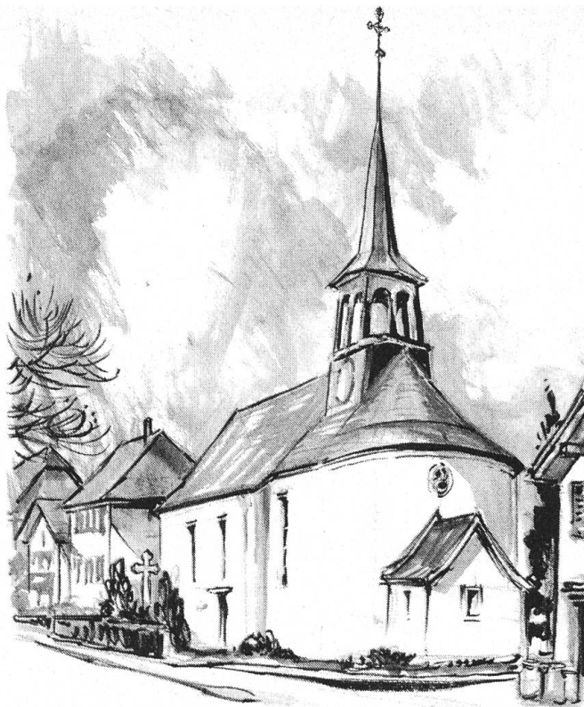
Härkingen: Alte Kirche. Der Beitrag des HS erst löste die Aussenrestaurierung dieses hübschen alten Dorfwahrzeichens aus. Das Innere wird zum Mehrzweckraum.